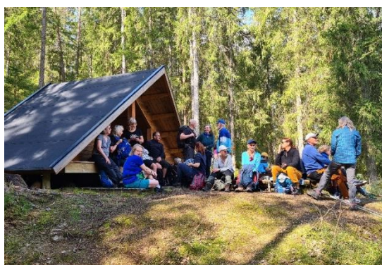
Bild från inspirationsvandring i Munkedal