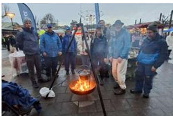
Friluftsförbundet på Munkedals kalaset tillsammans med Naturtid som föreningen anlitat och Ledare som var på plats på Jul i Munkedal