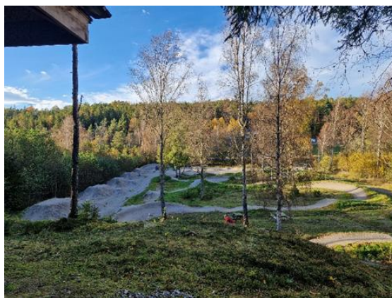
Pumptrack i Strömstad