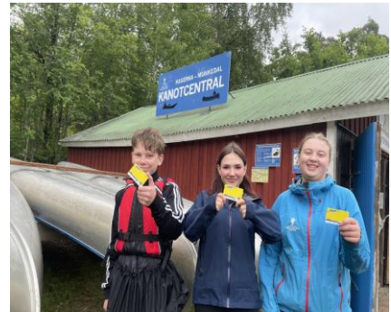
Personal med Gult paddelpass!