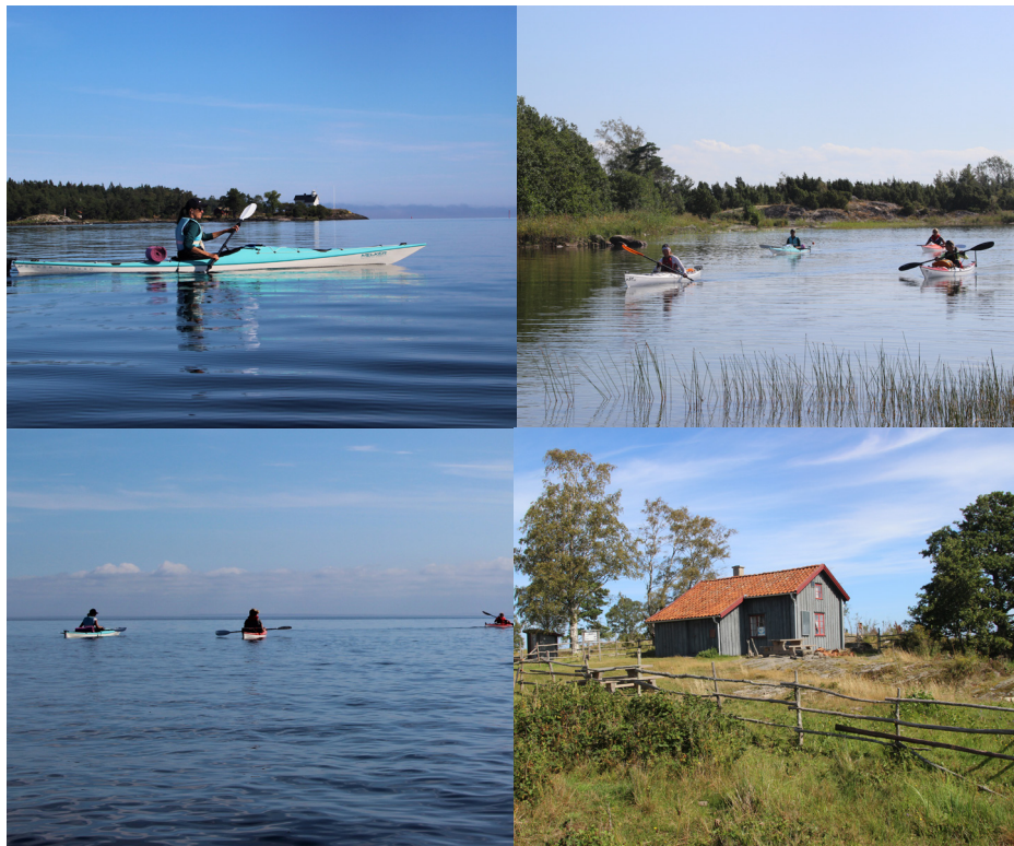
Från Lurö skärgård augusti 2019.