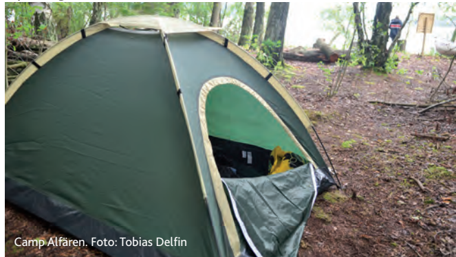
Camp Alfären.

Världsunika fossiler från Kritatiden har insamlats inom området Forskning och utgrävning pågår. Mer information om guidning via Filip Lindgren tel. 0708-843164 eller www.fossilforum.se