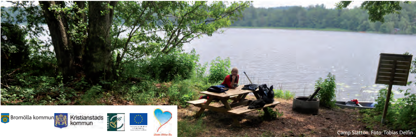
Camp Slättön.

Besökaren ansvarar för att platsen lämnas i snyggt och städlat skick. Materiel och avfall tas med tillbaka!