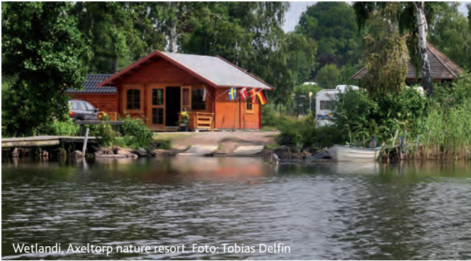
Wetlandi, Axeltorp nature resort.