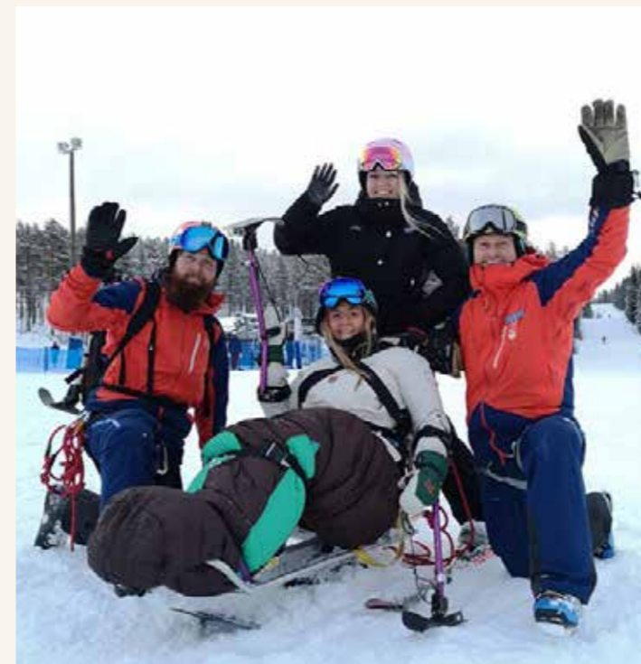
Foto från Idre i januari 2019 samt från Idre respektive Sälen i november och december.

Det tidigare externfinansierade utvecklingsprojektet SkiCamp har lett till att regionen nu har möjlighet att bedriva prova-på skidåkning för barn och unga som har någon typ av funktionsnedsättning och utbilda fler ledare inom paraskidåkning. Under 2019 erbjöds åkning med hjälp av sitski, skicart eller biski i Vetlanda, Mullsjö och Vadstena med totalt 17 deltagare. Regionen genomförde en biski-instruktörsutbildning i Idre Fjäll samt en utbildningsdag för åtta blivande biski-medåkare i Vetlanda. I samband med regionens fortbildningshelg i Sälen erbjöds möjlighet för alla skidledare att prova-på paraskidåkning. Under utbildning 1 skidor genomfördes ett moment med prova-på åkning för blivande skidledare.