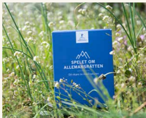
Spelet om Allemansrätten finns både som en kortlek (bild ovan) och i digital version, som nås via Friluftsrämjandets hemsida.

Utvecklingsarbetet bedrevs i samarbete med Studieförbundet i Jönköpings län och ungdomsorganisationen Sverok med stöd av Naturvårdsverket. Arbetet resulterade i ett kortspel om Allemansrätten som i dialog med Friluftsrämjandets riksorganisation fick namnet "Spelet om allemansrätten". Målet är att på ett lustfyllt sätt öka kunskapen om hur man ansvarsfullt och hållbart umgås med naturen. Ansvaret för nytryck och försäljning av kortspelet ligger nu på Riksorganisationen Spelet kommer att kunna beställas via Friluftsrämjandets webbshop. Dessutom finns en digital kortversion på Friluftsrämjandets hemsida. De projektmedel som beviljades från Naturvårdsverket redovisades sommaren 2019.