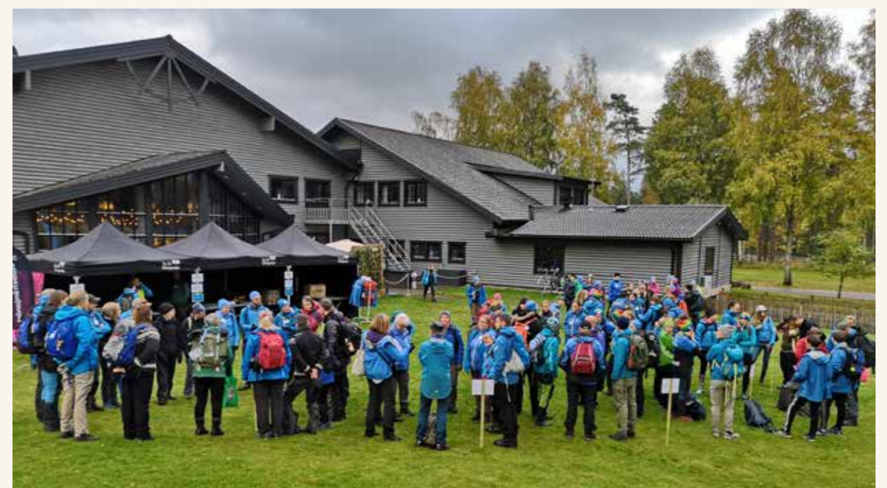
Utblick, Friluftsrådet's nationella fortbildningshelg på Isaberg i oktober.