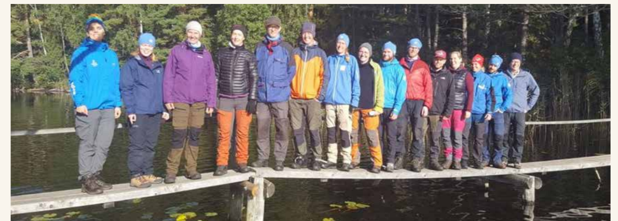
Bilder från utbildningen Vildmarksäventyr i Borensberg, 2019.

Några kursledare har deltagit i Region Östs utbildningshelg Utblick. Exempel på saker som kursteamet erbjuder: Äventyrspedagogik, Äventyrslekar, Planering av verksamhet, Knoppar och skogspyspel.