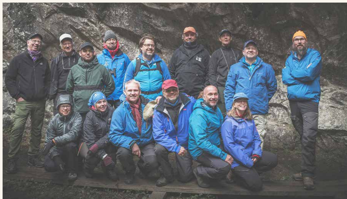
Övre bild: Region Öst erbjöd för första gången i oktober en heldag med scenariobaserad kurs i L-ABCDE för friluftslivets ledare. Nedre bild: Låglandsvandringsledarutbildning, Sixtorp, maj 2019.