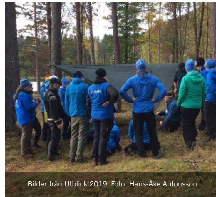
Bilder från Utblick 2019.