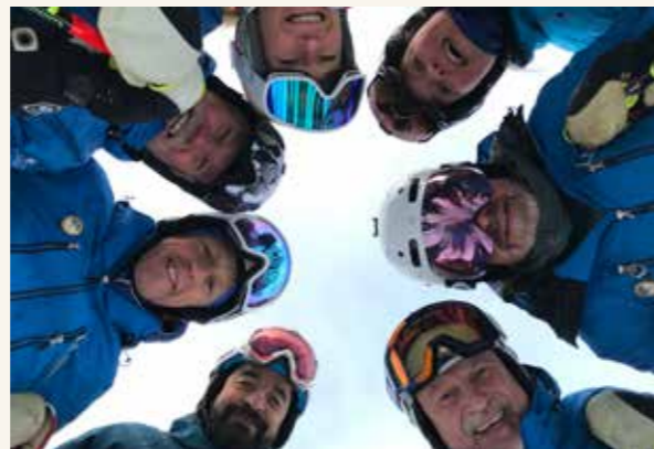
Nationell alpin upptakt i Idre.

Under året som gått har alla utbildningsteam i regionen börjat att använda Teams, Friluftsrådets digitala plattform, som kommunikationskanal men även som bank för dokument samt utbildningsmaterial. Detta skapar en lättillgänglighet för alla