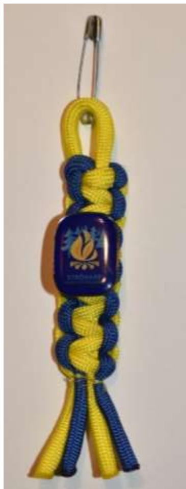
En färdig strövarmedalj.