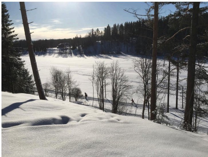
En underbar vinter