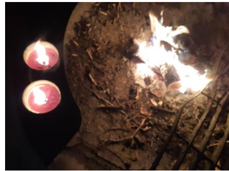
Bild från Luciavandringen 13 dec.

Vi har bland annat haft historisk vandring till Gåseborg i Hässelby, luciavandring runt Judarsjön, vandring på Munsöleden på Ekerö, skräpplockarvandring och 2 vandringar i Nacka med bastu som avslut. Några vandringar fick ställas in under året på grund av för få anmälda.