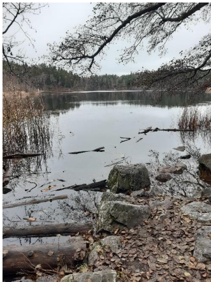
Sjön Judarn i Judarskogen

Västerorts Lokalavdelning har ingen egen stuga som gemensam samlingspunkt, utan våra olika grupper utnyttjar aktivt de fina naturområdena i vi har i vår närmiljö. Hela tre av Stockholms Naturreservat ligger i Västerort: