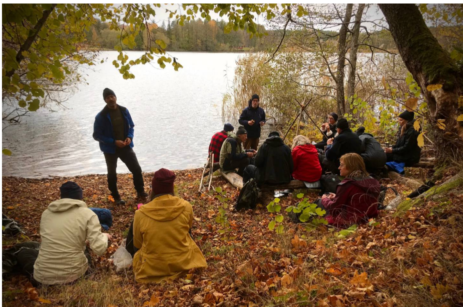
Höstvandring Hällsboskogens naturreservat–Billby beach

Stavgång. Har funnits många år i lokalavdelningen. Under våren genomfördes 23 vandringar och under hösten ytterligare 17. De flesta vandringar gick i Sköndalskogen, men ibland även på andra platser, t ex Steningebadet, Rosersbergsparken, vattendammarna Brista utmed Märstaån och Rävsta. Ca 10 deltagare i genomsnitt per vandring.