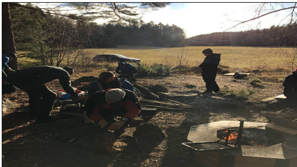
Introduktionskurs i bushcraft.

Ledarutbildning. Under året gick en ledare i lokalavdelningen ledarutbildning längdskidåkning och under 2022 är ambitionen att komma igång med grundkurser i längdskidåkning.