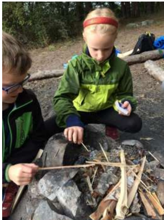
Som strövare lär vi oss att göra upp eld.