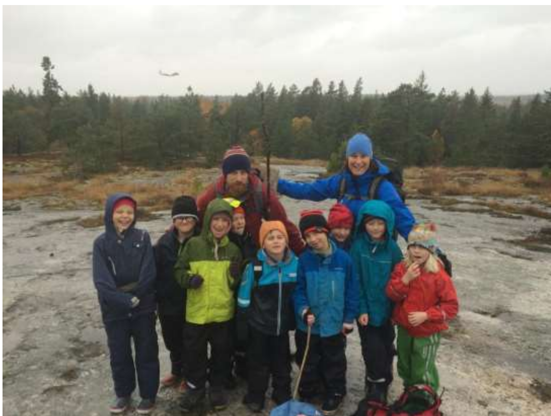
I regn och med glada miner besteg vi kommunens högsta berg, Järnberget, 65 möh. Vi såg många flygplan som landade på Arlanda.