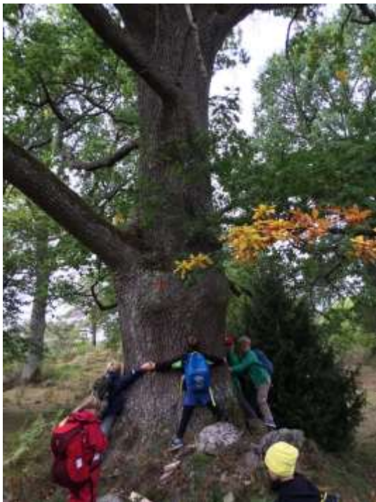
Vandring i Morga Hage. Samarbetsövning kring den stora eken.