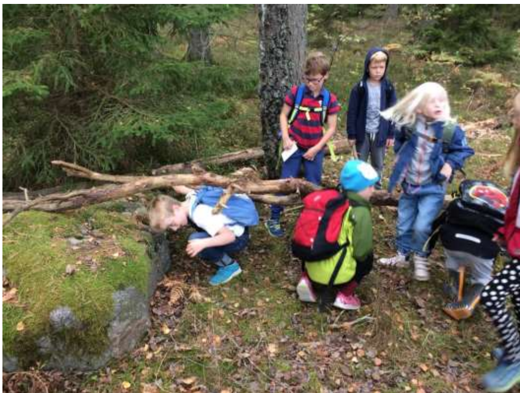
På Äventyrsdagen fick vi krypa, hoppa, leka och prova att baka magbröd.