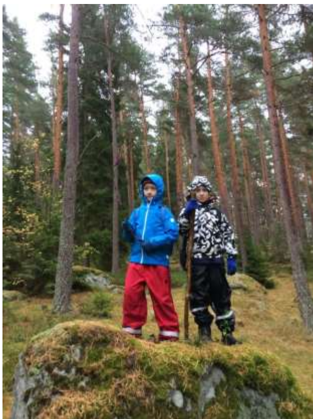
Vi klär oss efter väder!