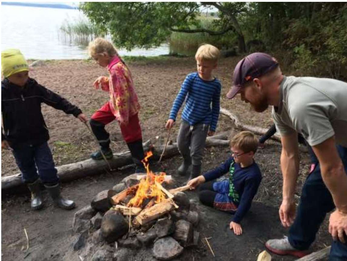
Vi lyckades med elden! Vilka Strövarbarn vi har!