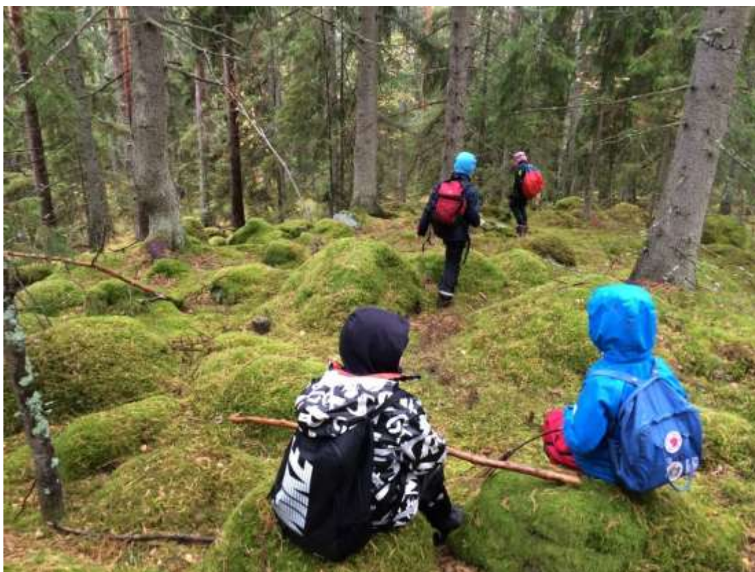
Reflektion i trollskogen. Nära vår lägerplats finns denna fina plats i Rävsta reservatet.