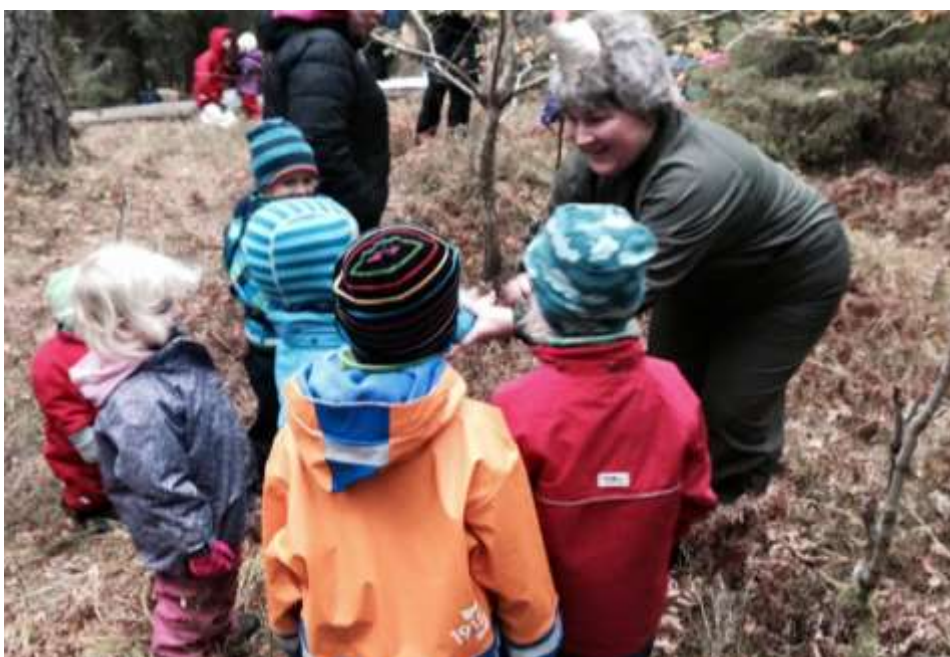
Besök av Skogsmulle