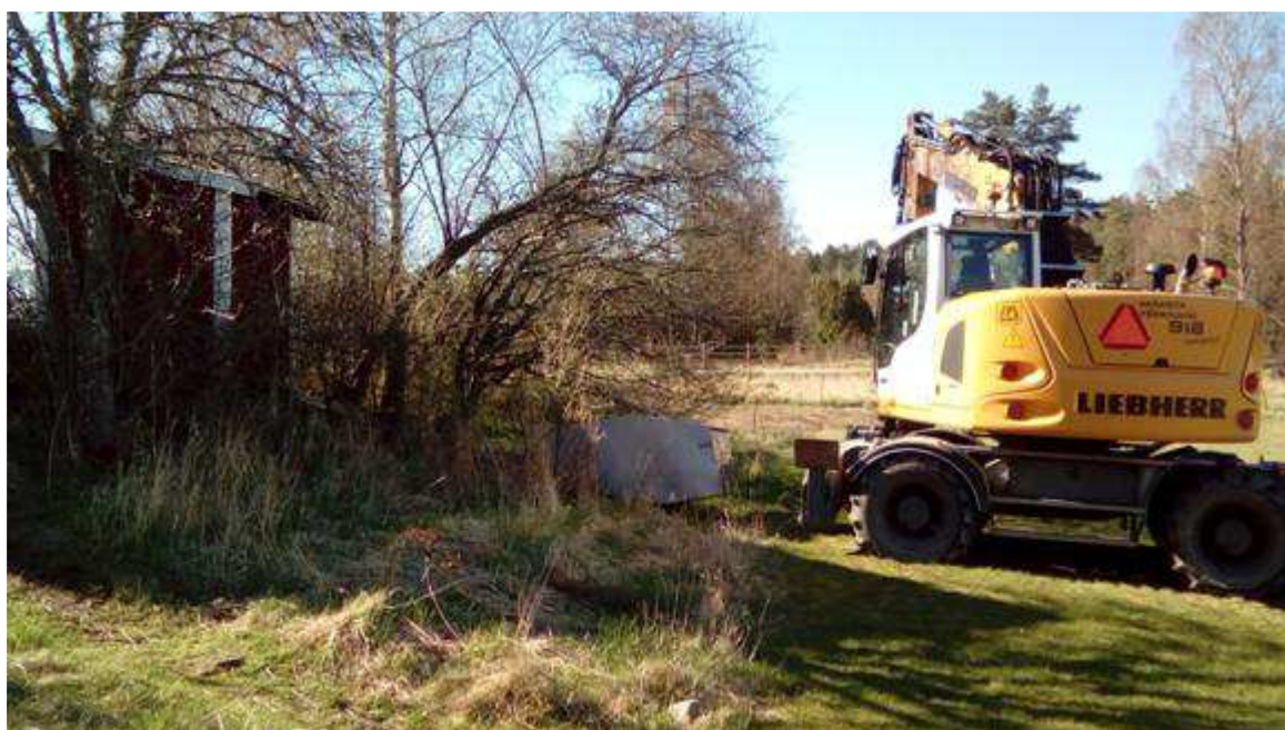
Den nya är på väg in