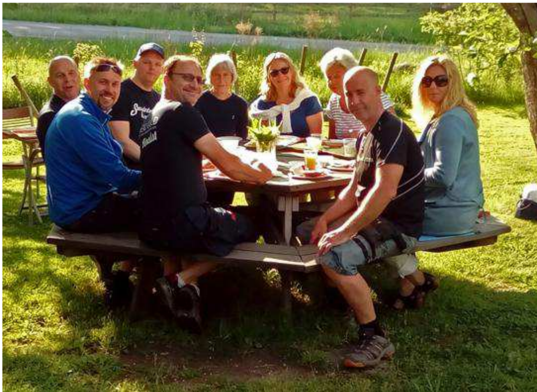
Vi njuter av strålande försommarväder vid Embarboda.

En mångårig tradition är att Sandström Elfirma firar friluftsmorgon med frukost nere vid Embarboda. Det är Sandströms som står för frukosten och detta har också utvecklats till en vidhängande sponsring av vårt vandrarorp. Embarboda. Det uppskattar vi mycket.