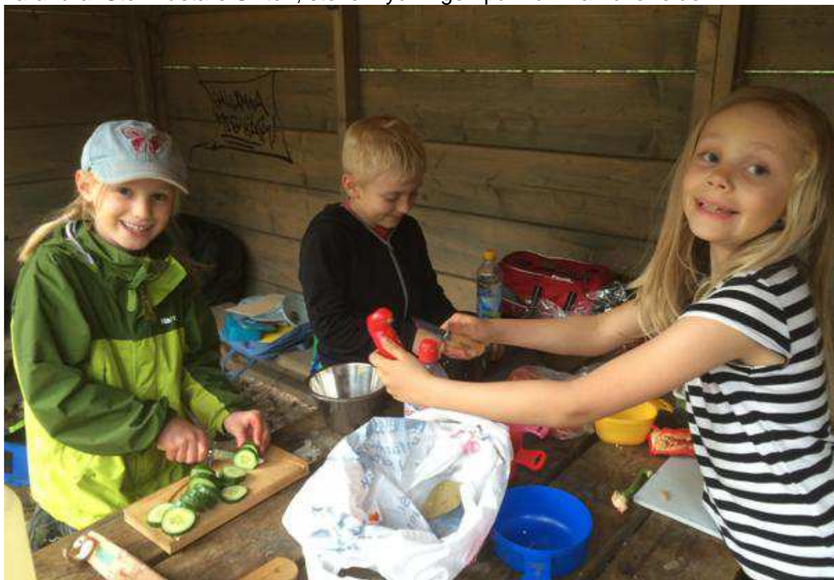
Här hackas det gurka, tomat och paprika till vår taco-kyckling med tortilla!