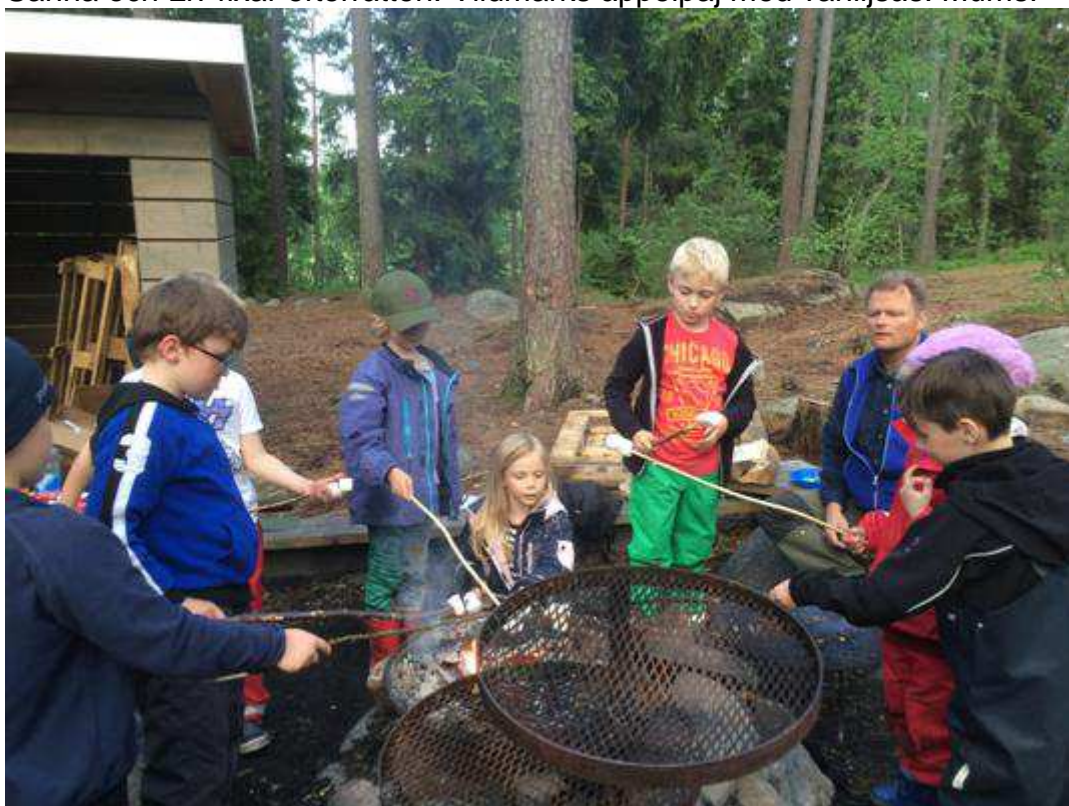
Favorit i repris: Mashmallows grillning