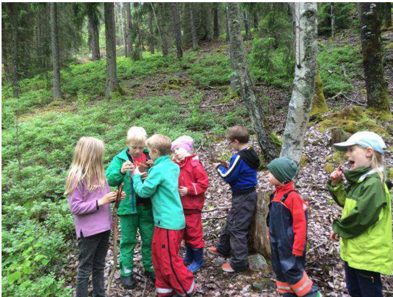
Här fann vi Geo-cachen i stubben! Och vi bytte vår snäcka mot en kapsyl med en älg på. Mycket passande då vi faktiskt är Strövargruppen Älgarna!