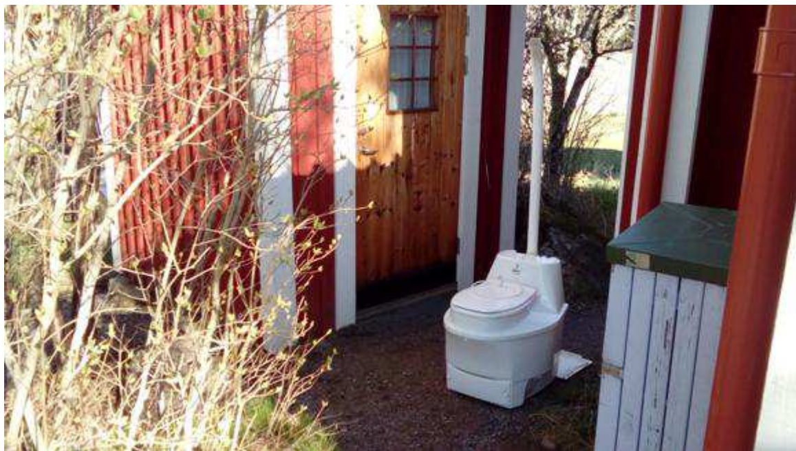
Den gamla är på väg ut

På morgonen den 2 maj kom äntligen kommunens styrkor till Embarsboda. Vi fick vår nya MULLIS installerad.