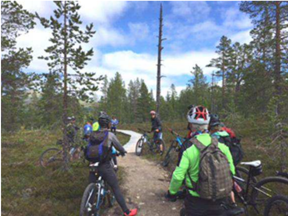
MTB-utbildning vid Idre fjäll