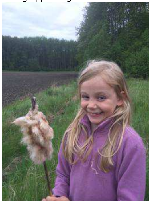
Sanna på upptäcktsfärd!