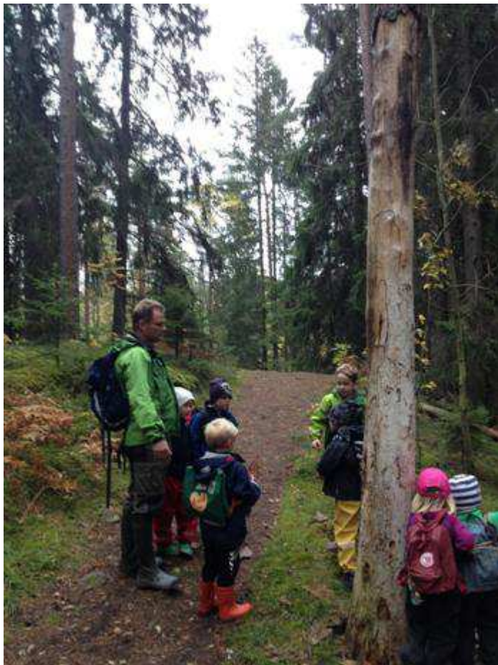
Vi gick en runda i skogen och fann ett dött träd som vi alla försökte få omkull, det var inte lätt.