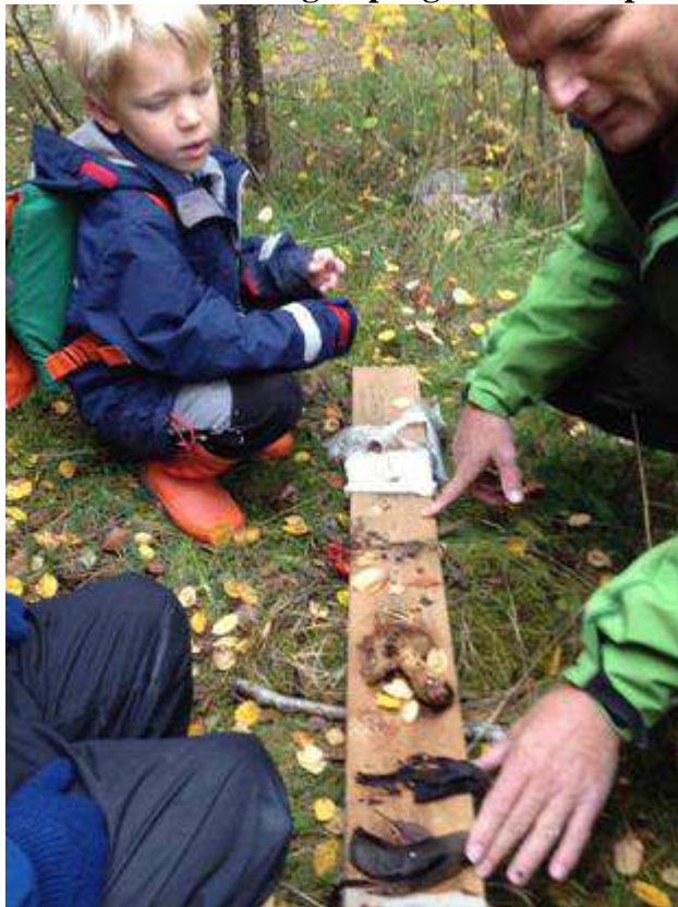
Vi kikade på vår kompostbräda. Bananerna hade blivit svarta, svampen förmultnat lite men plastpåsen och hårspännet såg likadana ut.