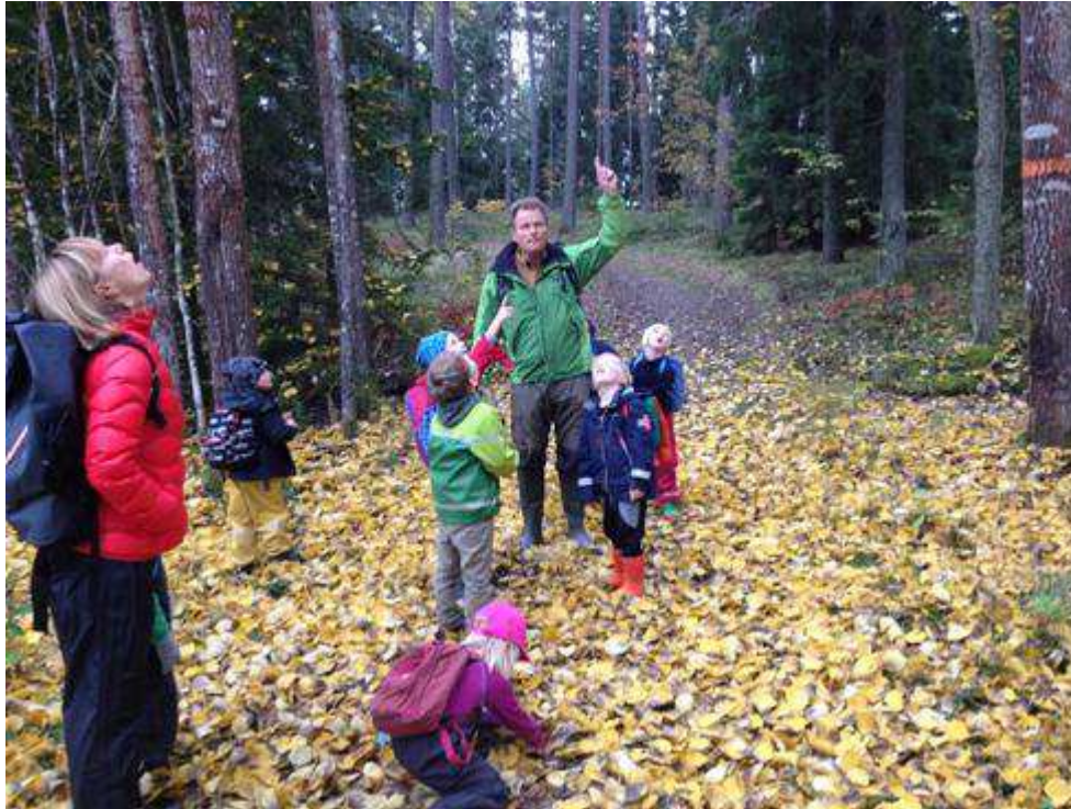
Vi fann massor av "guldpengar" bland aspens gula blad. Bladen föll ner hela tiden.