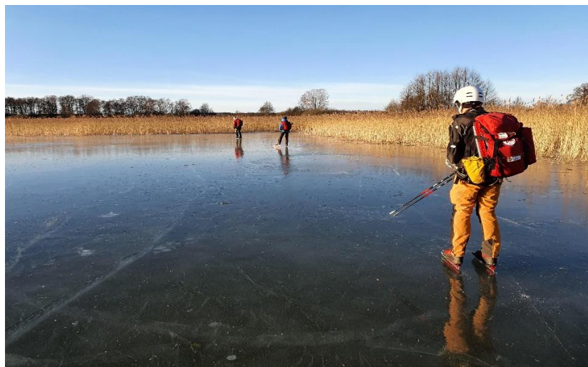
Skedviken och Varpsund

I november hade ledarna ett uppstartmöte med planering och genomgång av rutiner inför den kommande säsongen.