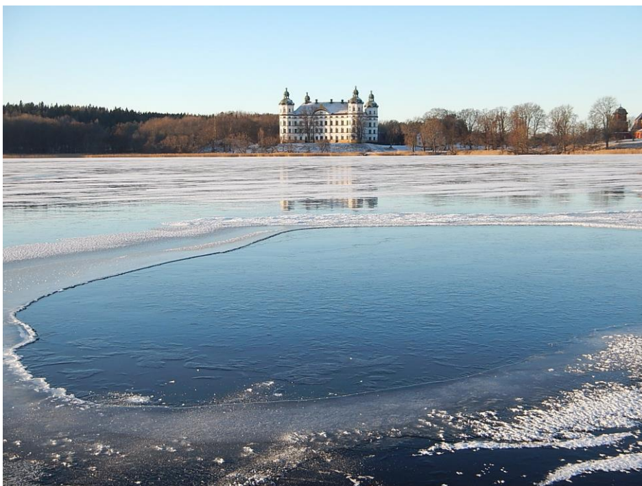
Lördag 27/12 2014. De 12 från FF Knivsta passerade före detta slottspolen tillhörande Skokloster.