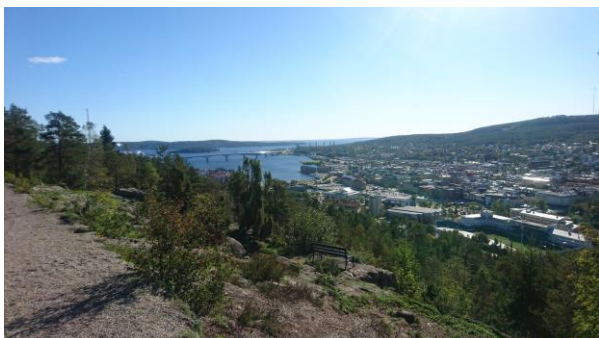
Vy från Allemanutslingan på Norra Berget