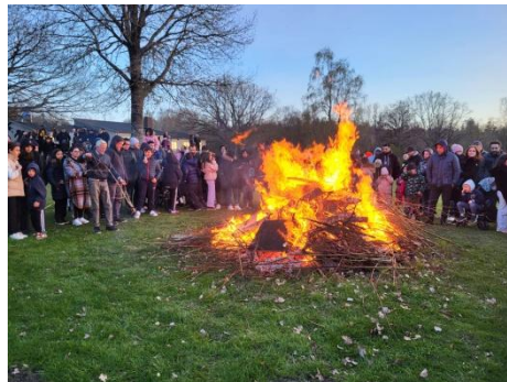
Elden tog sig bra