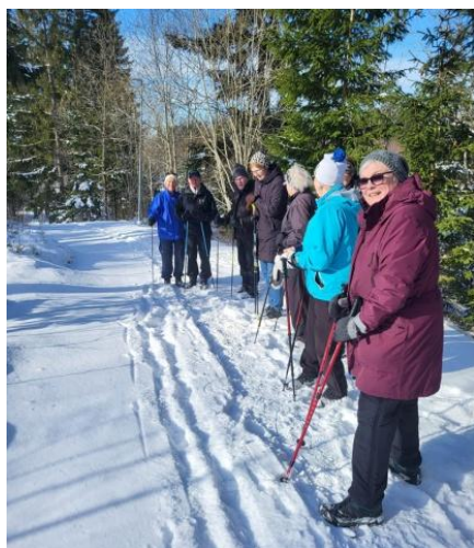
Stavgångare i snön, mars 2023