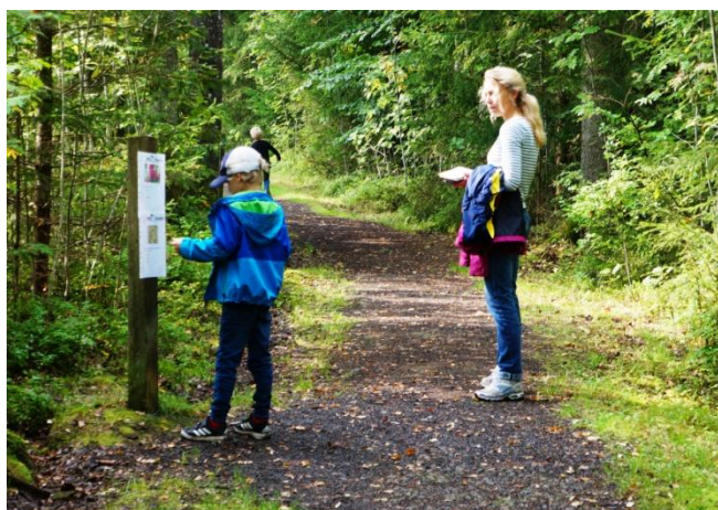
En mycket trogen tipspromenerande familj