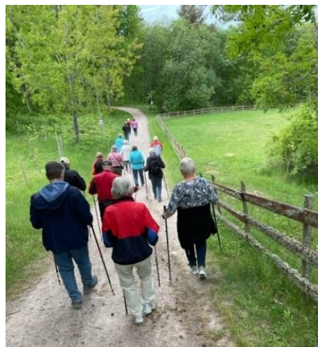
Stavgång på Grännaberget, juni 2023