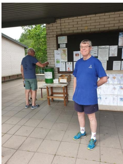
Välkommen på tipspromenad!