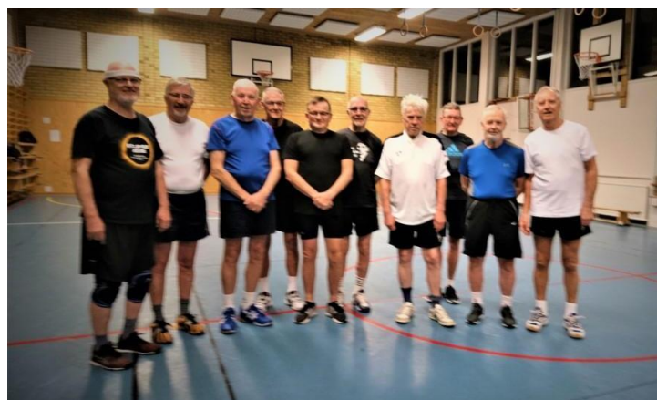
Glada motionärer i Stensholmsskolan