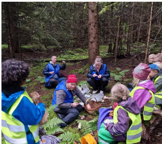
Svampgenomgång och även tillagning