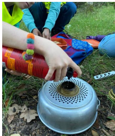
Matlagning på stormkök