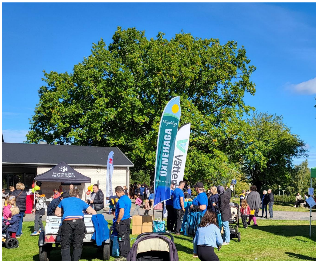
Samarbete med Vätterhem under Öxnegårdsdagen