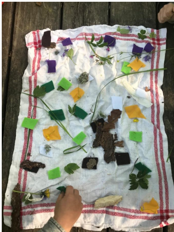
Naturtavla gjord av Mullebarnen