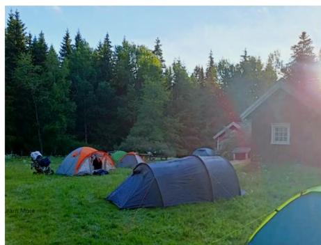
Övernattning i tält i Råbyskogen

Våravslutningen hölls tillsammans med en övernattning i tält där hela familjen var välkommen. Vi träffades på Öxnegården en lördag och samåkade till Råbyskogen där vi slog upp tält, lagade mat på stormkök, lekte lekar och umgicks. För vissa av barnen (och familjerna) var detta första gången de sov i tält, alla tyckte att initiativet var kul och förhoppningsvis gav det mersmak hos alla.