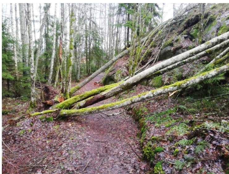
Nedfallna träd på milspåret i januari 2023