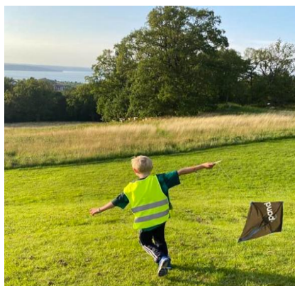
Byggda drakar flygtestas

Våravslutningen hölls tillsammans med en övernattning i tält där hela familjen var välkommen. Vi träffades på Öxnegården en lördag och samåkade till Råbyskogen där vi slog upp tält, lagade mat på stormkök, lekte lekar och umgicks. För vissa av barnen (och familjerna) var detta första gången de sov i tält, alla tyckte att initiativet var kul och förhoppningsvis gav det mersmak hos alla.