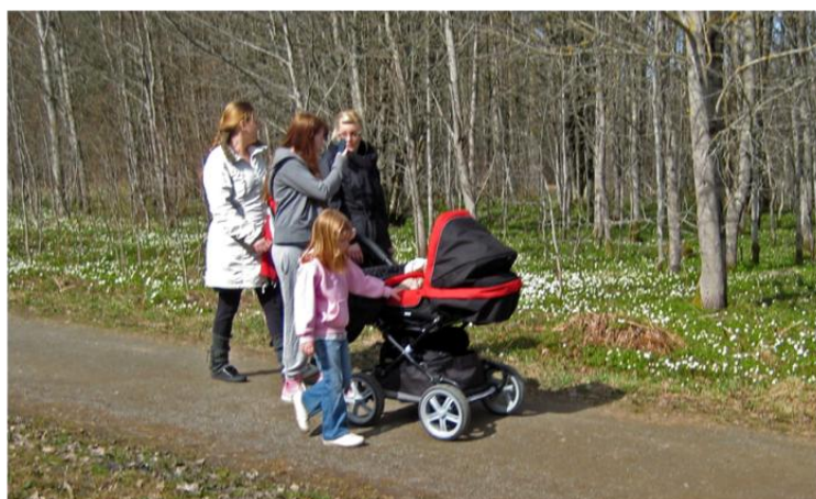
Tipspromenad en härlig vårdag