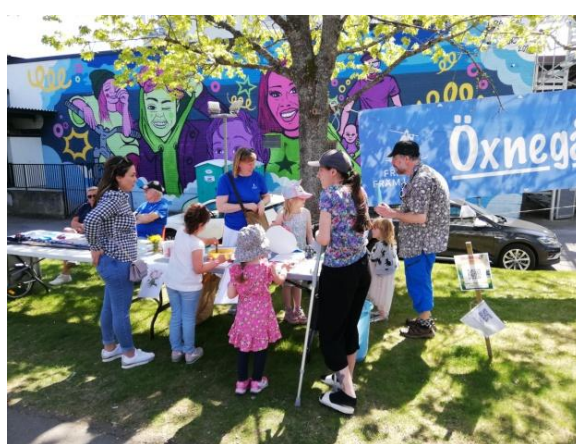
Delar av våra barnaktiviteter