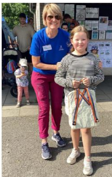
Några av de lyckligt lottade som vann en av våra fina priser i utlottningen

Deltagarna fick även chansen att testa sina kunskaper om Allemansrätten genom en mobilquiz, där en snabb skanning av en QR-kod öppnade dörren till tävlingen. Genom att svara korrekt på 10 frågor hade man möjlighet att delta i en spännande utlottning med lockande priser som belöning. Många engagerade deltagare tog sig an quizets utmaningar eller vandrade Allemansrättsleden. Dagen erbjöd även en uppskattad tipspromenad, som lockade många deltagare att delta i denna underhållande aktivitet.