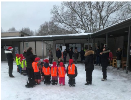
Projektgruppen träffar dagisbarn vid Öxnegården