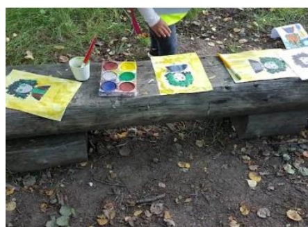
Målning med vattenfärg med penslar och naturens verktyg som pinnar och löv