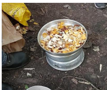
Svampplockning och stekning på Trangiakök + avsmakning