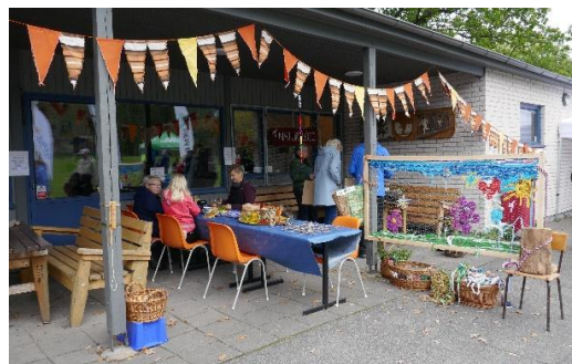
Naturslöjdarna visade olika möjligheter