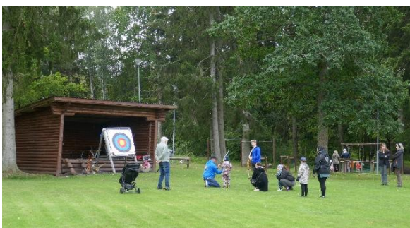
Bågskytte kunde man prova på