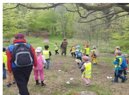
Barnen möter Skogsmulle