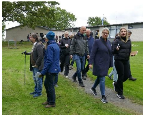
Gratis tipspromenad lockade