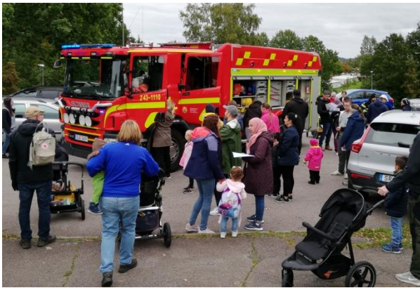
Brandbilen var mycket populär