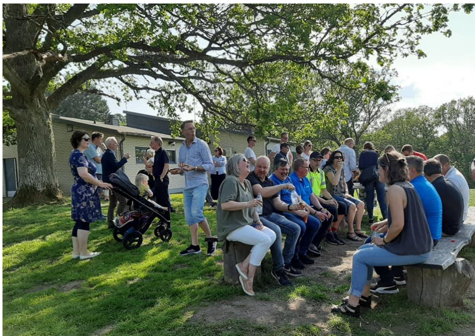
Vätterhems personalaktivitet vid Öxnegården i maj 2019