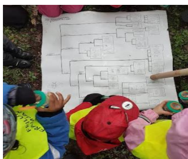
Koll av smådjur med lupp och familjebestämning