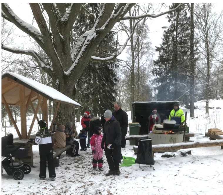
Godis och glögg delas ut vid grillplatsen