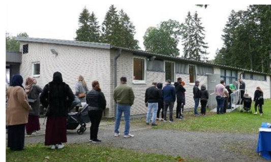
Kön var lång till Covid-vaccineringen