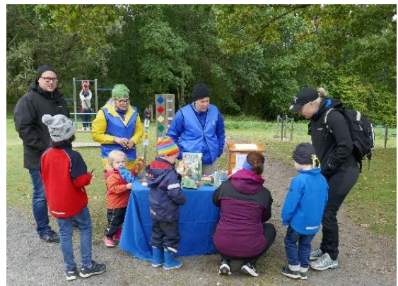
Start Mulles hinderbana och naturbingo