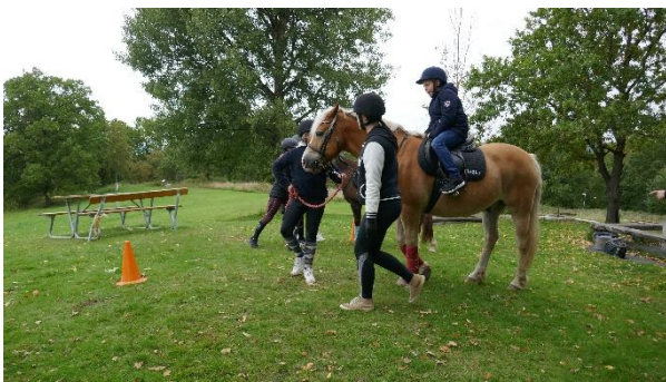
Ponnyridning, dit kön var lång