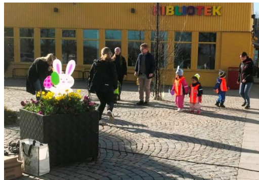
Barnen samlas i Öxnehaga centrum

Nu ser vi fram emot 2021 för att kanske då flytta tillbaka till Öxnegården.