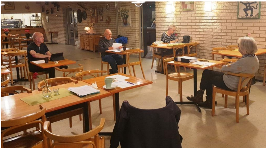
Styrelsemöte på Coronaavstånd