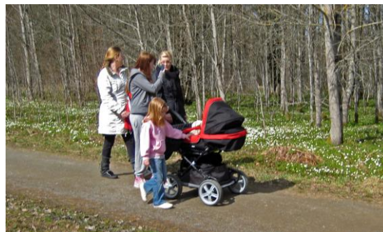
Barnfamilj på tipspromenad