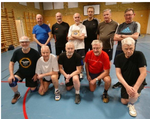
Glada motionärer i Stenholmsskolan