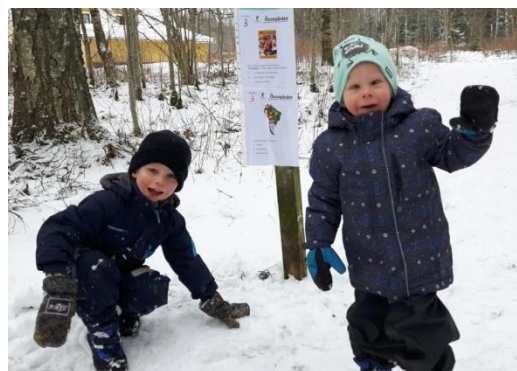
Glada barn på tipspromenad

Öxnegården har en mångårig tradition att parallellt med tipspromenaden för vuxna på söndagar även ha en tipspromenad för barn. Under året har vi haft 37 tipspromenader med totalt ca 900 deltagande barn. Många barn deltar även med liv och lust i motionsbingon. Trenden från 2019 höll i sig och antalet barnfamiljer ökade. I och med de tilltagande Coronarestriktionerna så var detta ett sätt för familjer att kunna träffas över 3 generationer.