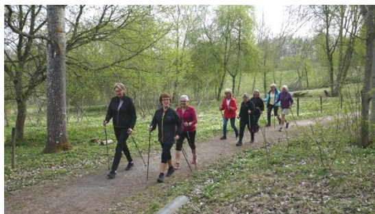
En del provade på att stava rätt