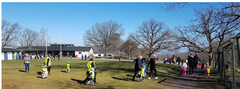
Barn på vandring under Blåkullaracet

Den 18 april invaderades Öxnegården av ca 130 påskkärringar och påskgubbar. Öxnegården tillsammans med Vätterhem och Öxnehagas förskolor arrangerade då "Blåkullaracet". Det har blivit lite av tradition nu, vilket både vi och barnen uppskattar. Först var det sång och dans framför scenen, därefter var det promenad/löpning på en liten snitslad bana och där alla fick ett diplom efter genomförande. Allt avslutades senare med saft och bullkalas.