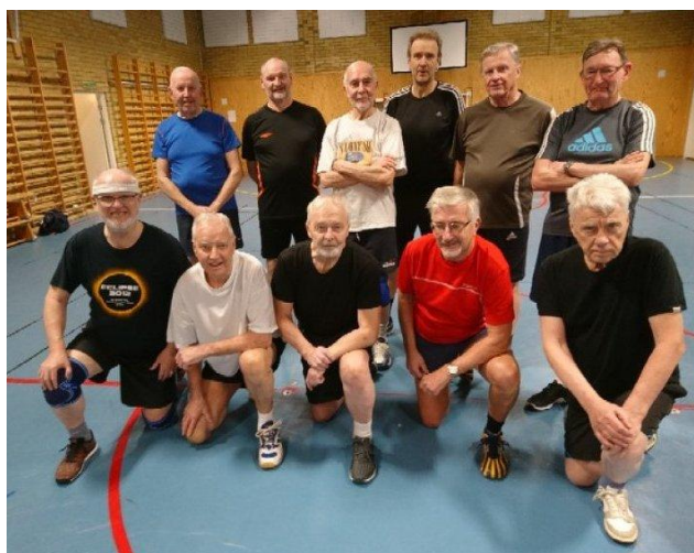
Glada motionärer i Stenholmsskolan 2019