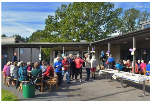
Tårtkalas på Öxnegården sept 2019