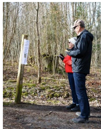
Tipspromenerare mars 2019