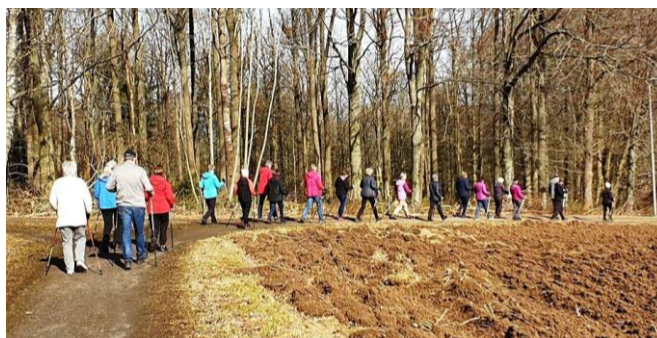
Våra stavgångare på höstpromenad sept 2019