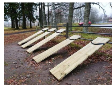
Utegyppet har renoverats

Det är roligt att se att vi åter har en "spårgrupp" på Öxnegården.