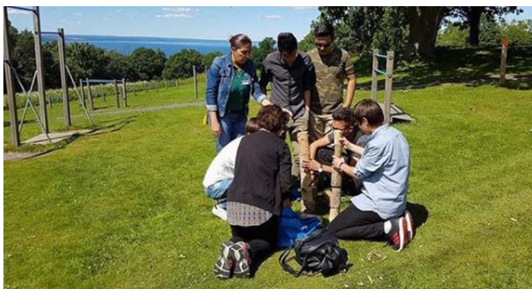
Aktiviteter vid Öxnegården under Sommarskolan