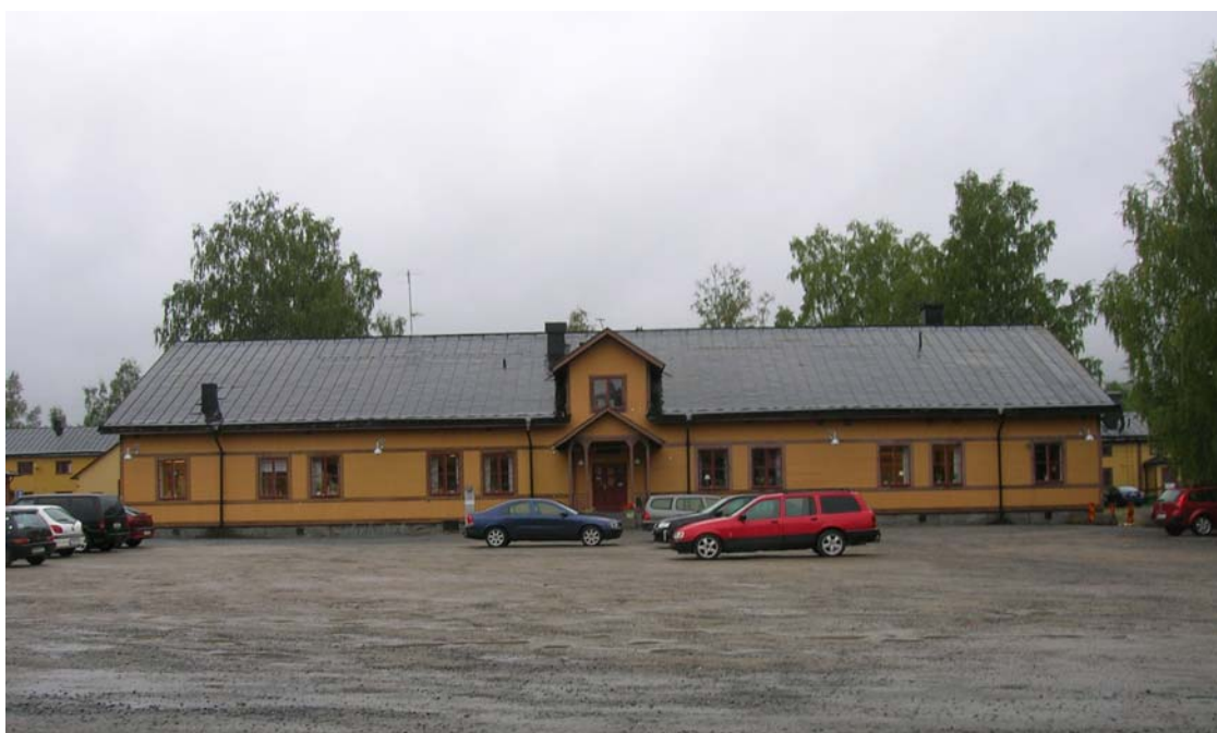
2008-09-02. Byggnad 008 med nya lyktor "Solo vägg".