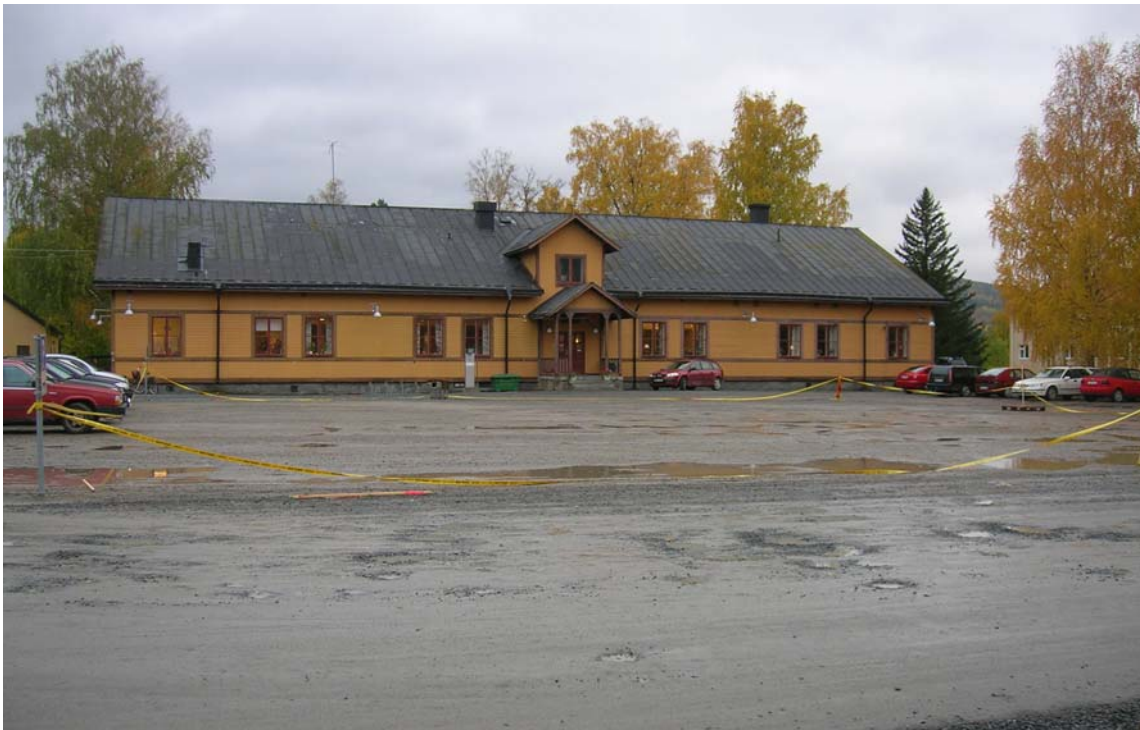
Byggnad 8, Beväringkasernen. Foto 2008-09-02.