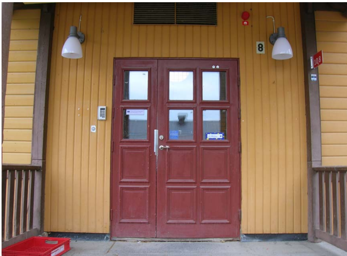
2008-09-02. Byggnad 8 efter byte till nya armaturer, Klippan 230.