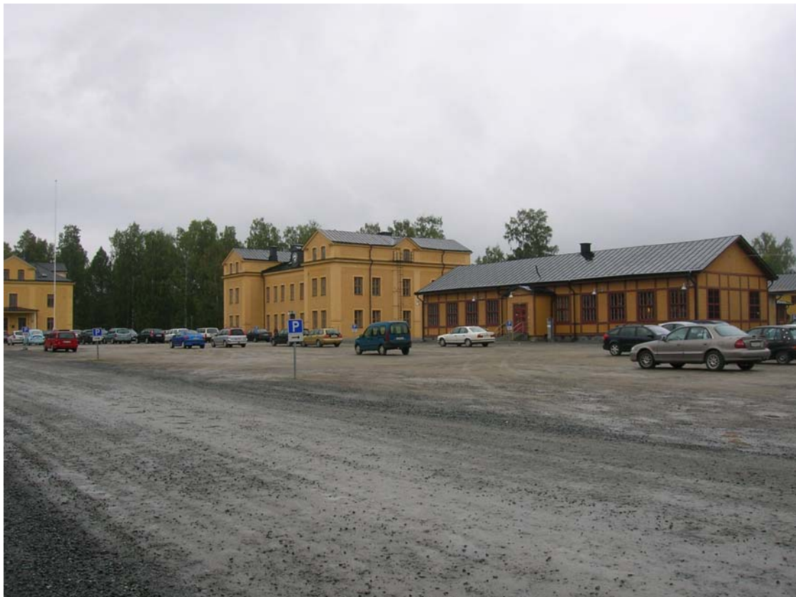
2008-09-02. Södra sidan av kaserngården. Närmast byggnad 4. Efter montering av nya armaturer.