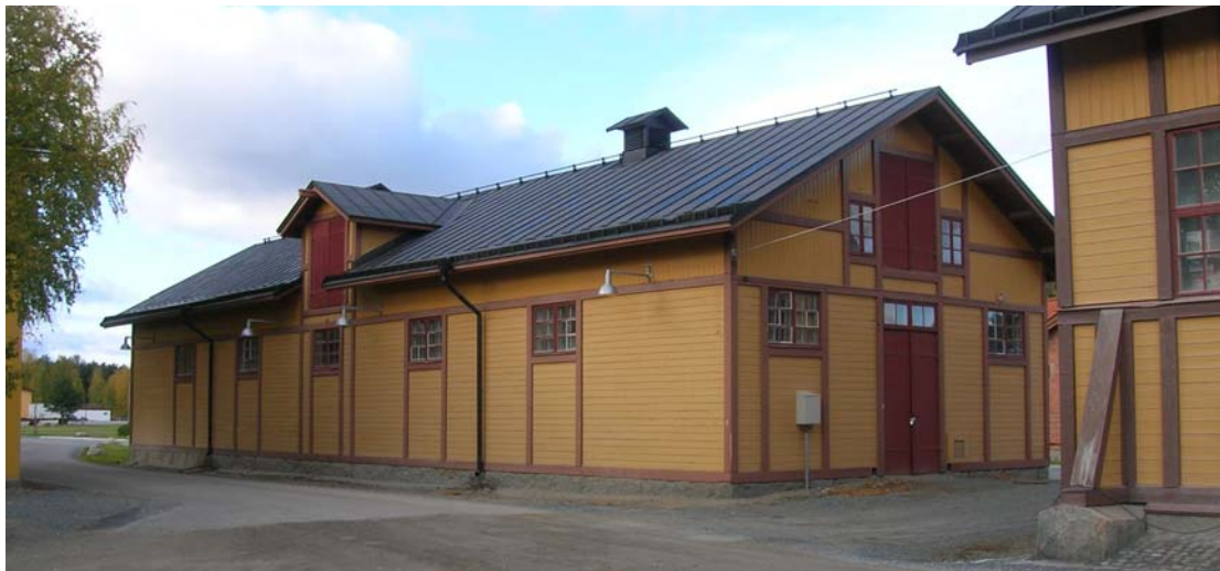
2009-09-30. Byggnad 014, nu med rätt placering och antal, även på huvudfasaden.