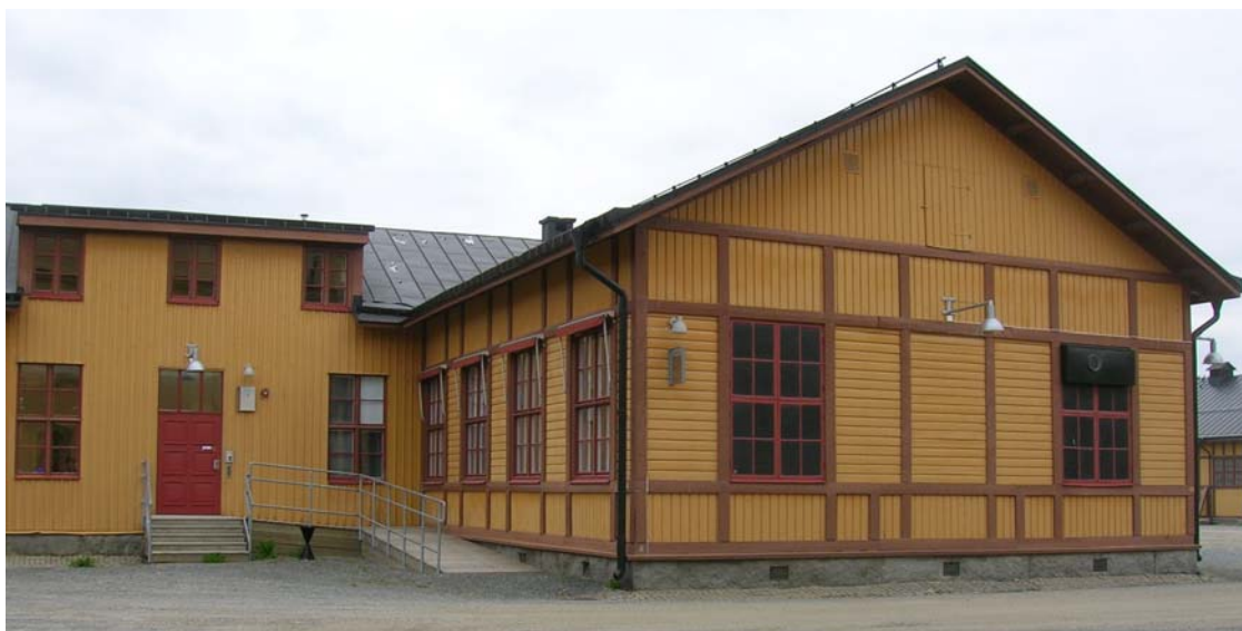
2008-09-15. Byggnad 004 med armaturer mitt på gaveln och på NO hörnet, vilka senare har borttagits enligt handling. (Små skyltar osv. finns monterade på husen sedan tidigare).