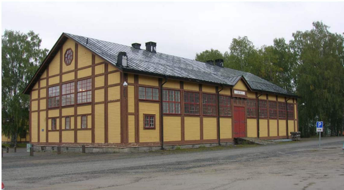
Fd. Exercishuset, (byggnad 017), foto 2008-09-02.