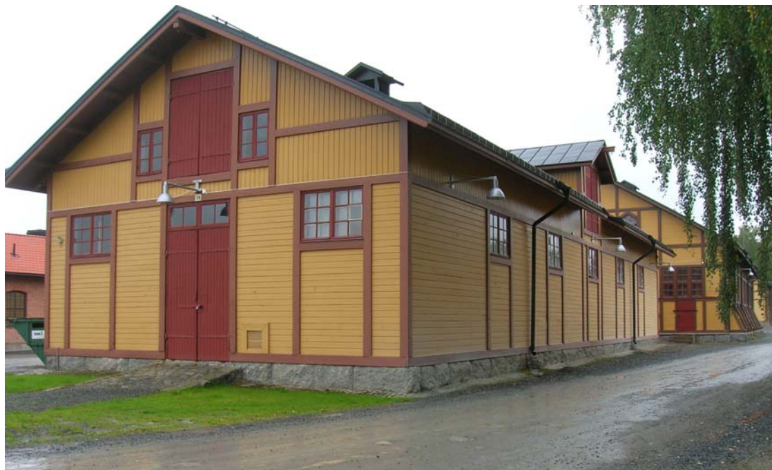
2008-09-02. Byggnad 014-015 med nya lyktor "Solo vägg", vars placering senare ändrades.