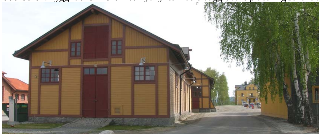
2009-05-18. Byggnad 014 med rätt placering på västra gaveln men ej framsida.