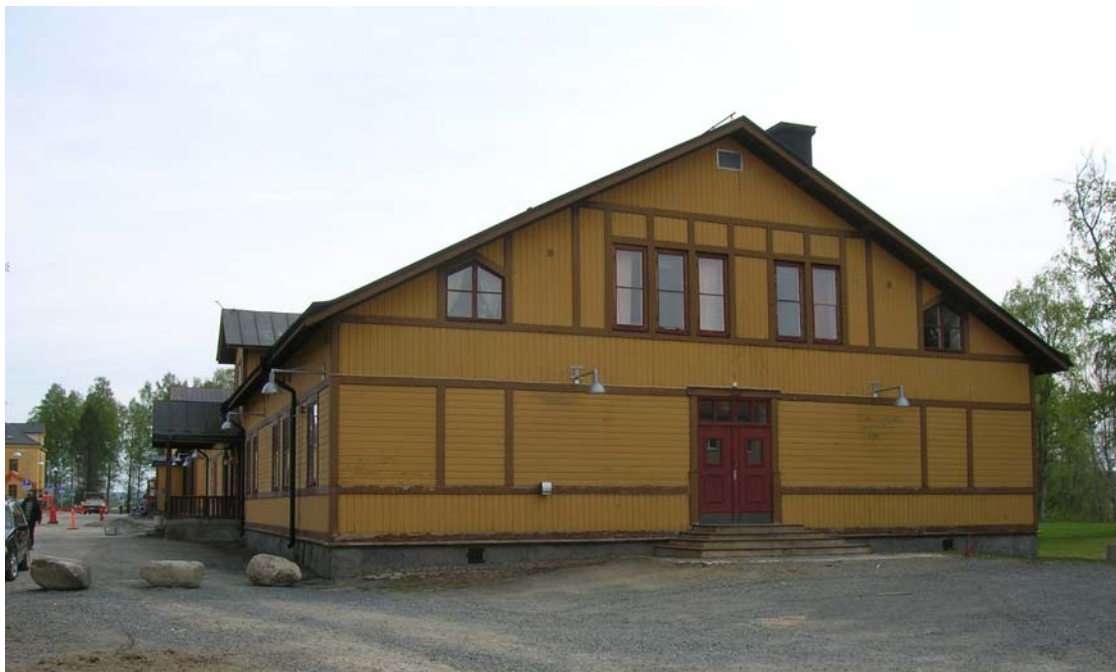
09 05-18. Byggnad 008 med nya armaturer "Solo vägg" och efter senare ändrad placering på gavelfasaden.