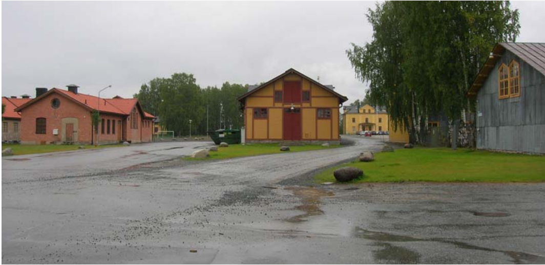
Infarten till höger leder till gamla kaserngården, foto 2008-09-02.

Man anländer på bilväg till södra kaserngårdens västra kortsida. I fonden längst bort vid kaserngårdens östra kortsida står det höga putsade kanslihuset med omgivande park. Idag används byggnaderna för kontors- och undervisningsverksamhet.