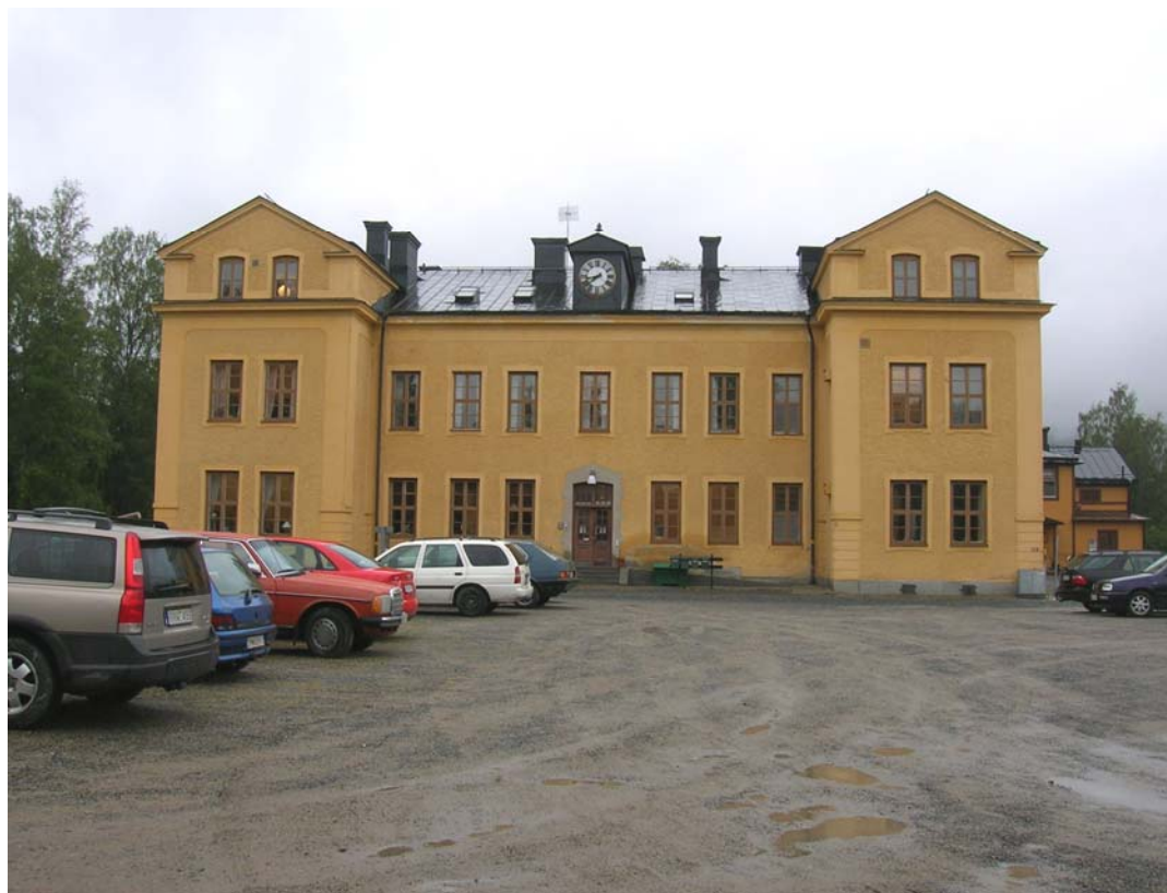
2008-09-02. Förvaltningsbyggnaden (A-kasernen, byggnad 002).