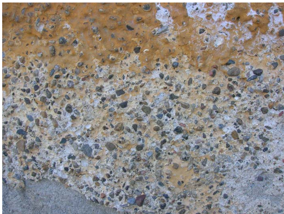
2009-06-24. Förvaltningsbyggnaden 002. Putsskada vid entrén med sannolikt platsblandad spritputs.

Huvudentrén, som ligger i skuggan mot norr och suger upp vatten kapillärt i putsen och medföljande salter från tösaltning (synliga saltutfällningar) har orsakat saltsprängning. Skadorna har lagats med Porosanbruk (Keim) och på detta handpåsagen spritputs som har avfärgats. Porosanbruket ska kapsla in saltet och uppnå en längre beständighet innan nästa omputsning. Något mindre spritsten än befintlig har använts och färgen är fortfarande flammig efter ojämn sugning. Den kan ev. bedömas bättre nästa säsong. Kulören är något rödare än befintlig puts.