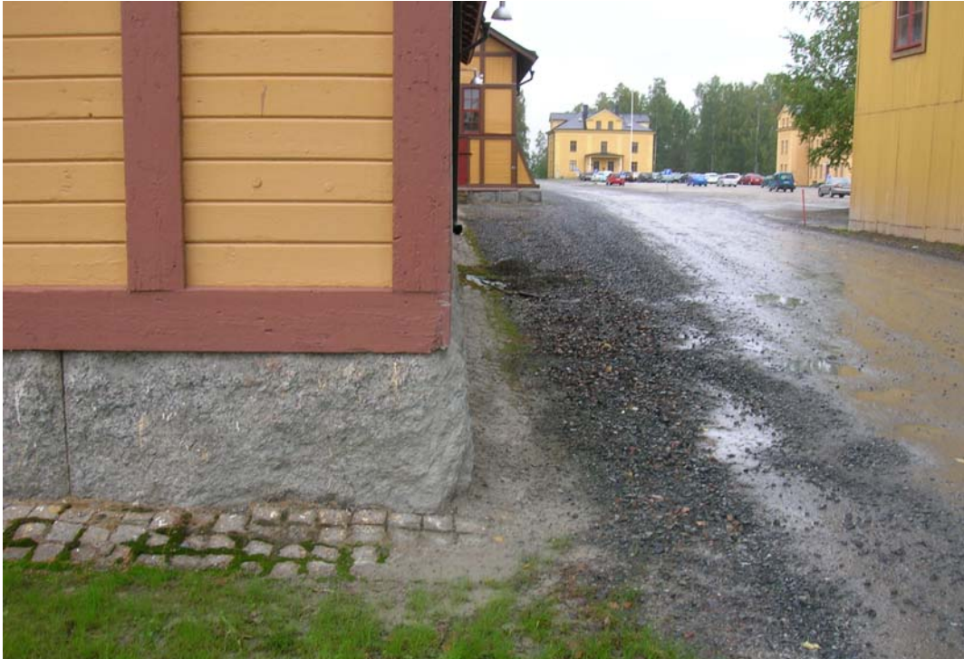
Infarten från väster till kaserngården, foto 2008-09-02 (Förrådsbyggnad 010, kortfasaden, till höger).