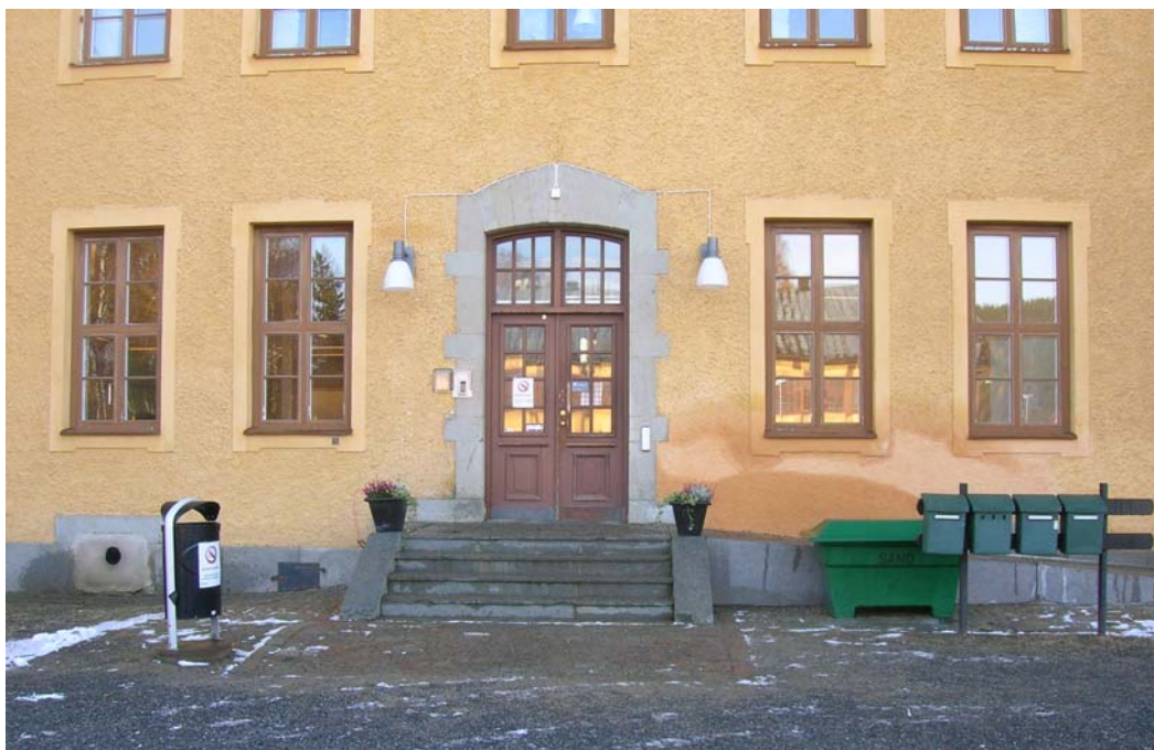
2009-10.20. Förvaltningsbyggnaden 002 efter avfärgning.