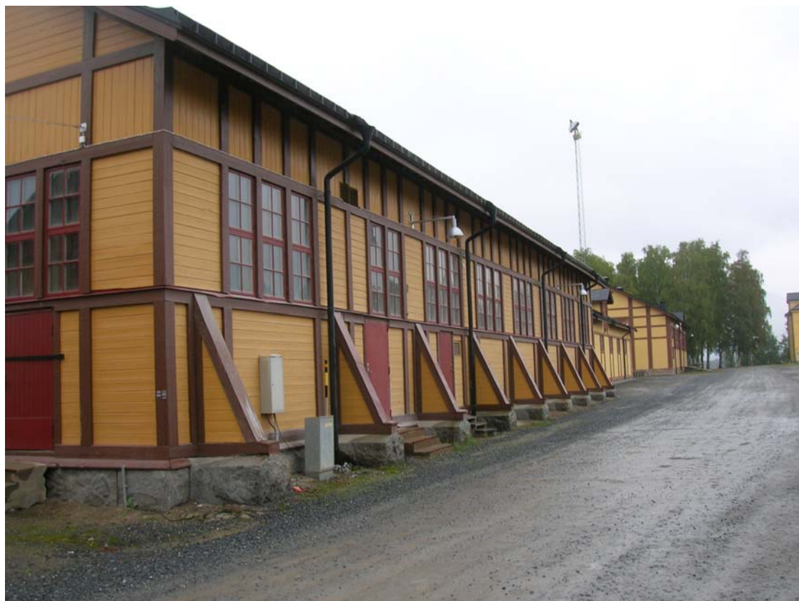
Byggnaderna längs norra sidan kaserngården; byggnad 015, "ridhuset", närmast (armaturerna ej satta enligt ritningar, vilket senare har åtgärdats).

Exercishuset, "gymnastiksalen", (byggnad 017) står längst österut på kaserngårdens norra sida, närmast Kanslihuset. Huset byggdes 1897 i en våning är cirka 12 m hög och 18 m bred. Den västra änden byggdes i två plan från början. Huset har stora, kvadratiska, tättspröjsade fönster taket var ursprungligen plättäckt, 1956 lade man tegel på taket, idag är taket täckt av svartmålad bandplåt. Byggnadens huvudentré har en centralt placerad dubbelpport med stensatt uppfartsramp. Porten har överljus och ovanför står nybyggnadsåret på en skylt.