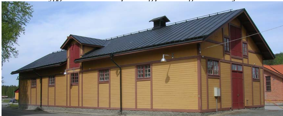
2009-05-18. Byggnad 014.