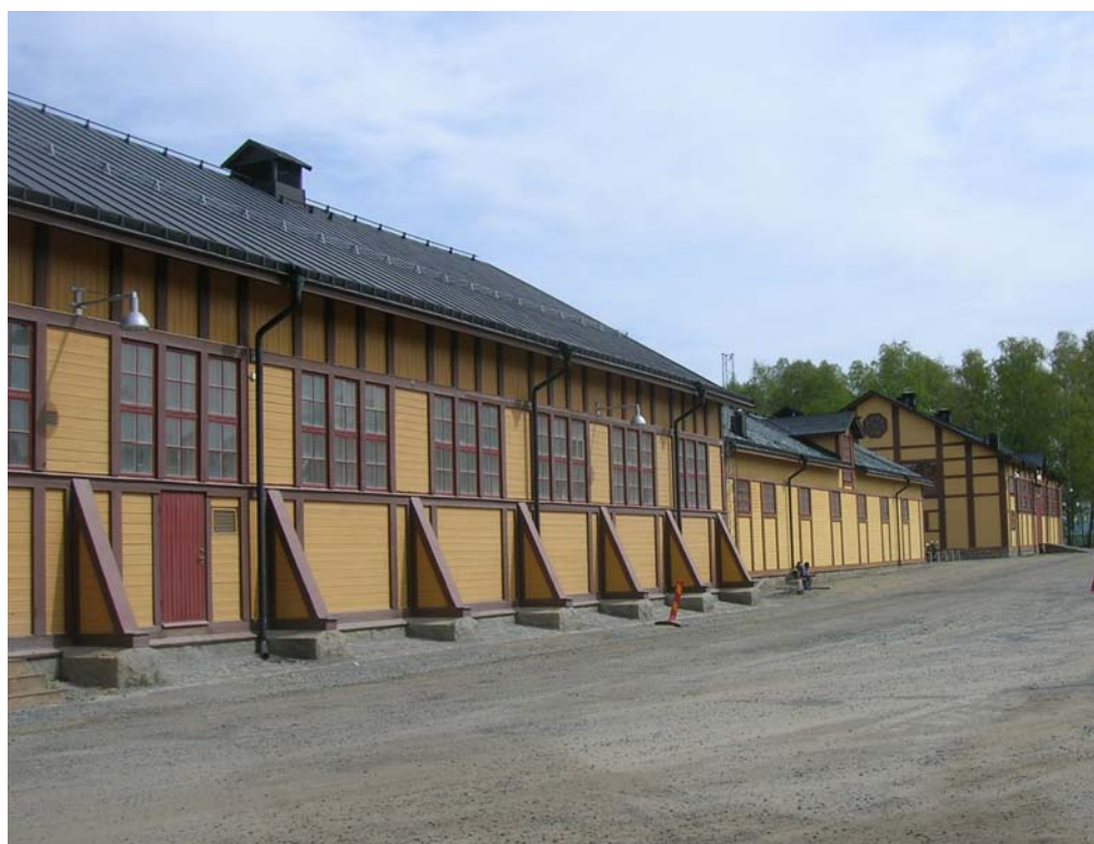
Remsle 13:64, Sollefteå kommun, Ångermanland