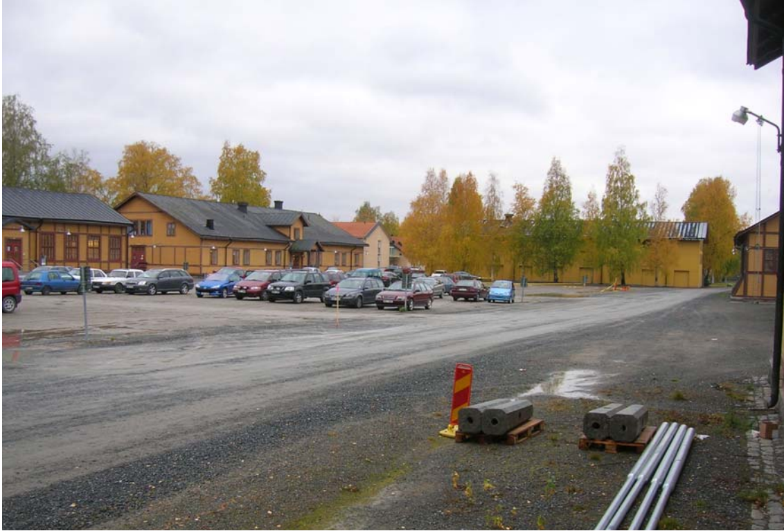
Södra sidan av kaserngården med byggnad 008 längst bort i raden. Förrådsbyggnaden står bakom träden på kaserngårdens västra kortsida. Foto 2008-09-02.