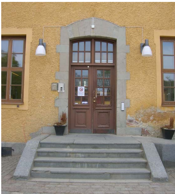
2009-05-18. Förvaltningsbyggnaden med nya armaturer som flankerar porten enligt ritning. (Senare inmålade el-dosa och ledning, putsskador, se sid. 20).