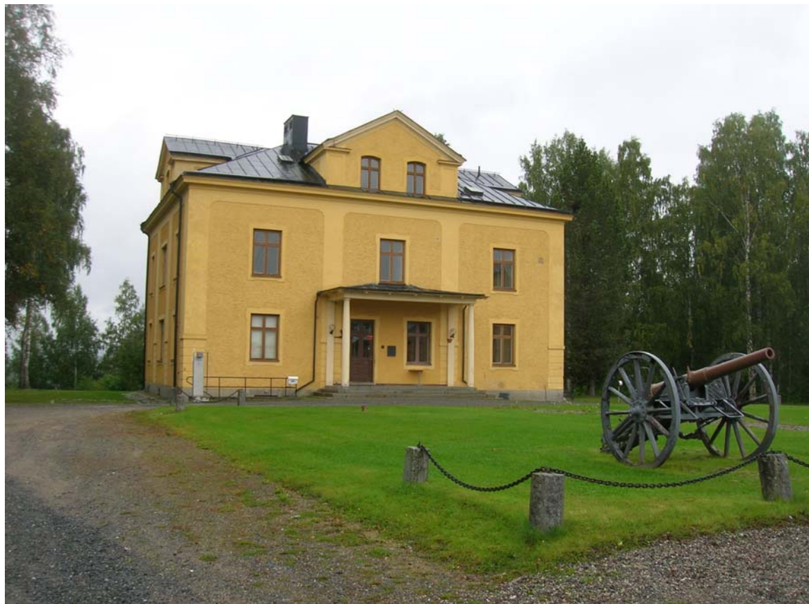
Kanslihuset (byggnad 001) står på kaserngårdens östra kortsida, foto 2008-09-02.

Kanslihuset i öster har två våningar med inredd vind och stomme av tegel. Det började byggas 1895 och uppfördes från början för sitt ändamål. Ursprungligen inrymde huset arbetsrum och expeditioner på bottenvåningen, officermäss med samlingsrum och matsal samt kök en trappa upp. Vindsvåningen var inredd med fyra tvärumslägenheter med kakelugnar för personal. 1951-52 genomgick kanslihuset omfattande ombyggnader ut- och särskilt invändigt. Då byggdes exempelvis huvudentrén om, förstukvisten ändrades och stentrappan breddades till att omfatta hela huvudfasaden och gavelfasadernas sidor. En källardörr sattes igen och flera fönster byttes ut. Invändigt skedde även förändringar 1972.