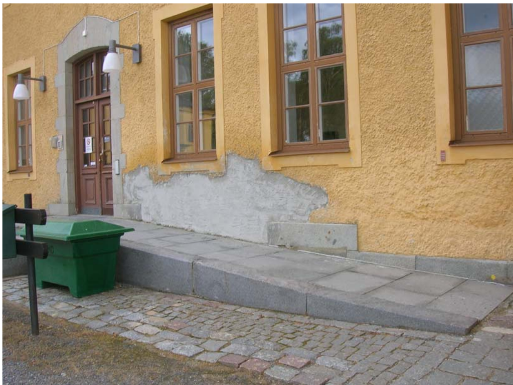
2009-08-25. Fasaden med påslag av Porosan.