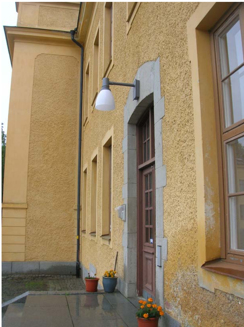
2008-09-02. Förvaltningsbyggnaden före ändrad placering av armaturer.