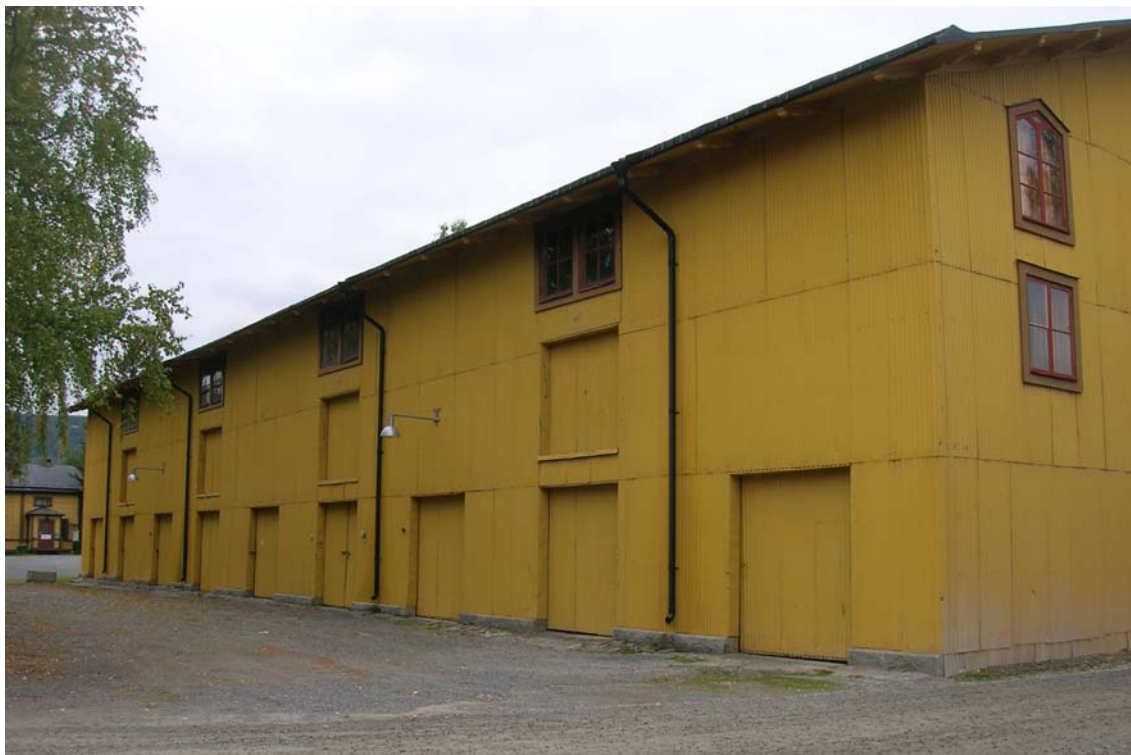
Förrådshuset (byggnad 010) sträcker sig utmed hela kaserngårdens västra kortsida (nya armaturer, placering och antal har senare justerats enligt handling. Infarten till kaserngården närmast. Foto mot söder

Förrådshuset (byggnad 010) ligger utmed kaserngårdens västra kortsida. Den långsträckt byggnaden är i tre våningar med trästomme och fasader av korrugerad plåt. Den kallades från början "Fordons- och utredningshuset" och var tänkt att uppföras i endast två våningar. Ursprungligen var bottenvåningen och en trappa upp avsedd för uppställningsplats för vagnar och rörliga uppfartsramper med hissar hissade upp vagnarna på den övre våningen. Dörrarna var inåtgående. Byggnaden används idag som förråd.