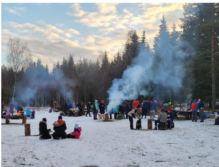
Full fart vid Lunsentorpet på Lucia 2021.

Det årliga arrangemanget med Lucia på Lunsentorpet i samarbete med Uppsala kommun och Knivsta kommun arrangerades söndagen den 12 december. Två vandringsledare ledde en vandring från Flottsundsbron till Lunsentorpet där alla aktiviteter var utomhus. På plats ställde även några funktionärer från Friluftsförbundet upp och bidrog bland annat med tomte och kaffekokning.