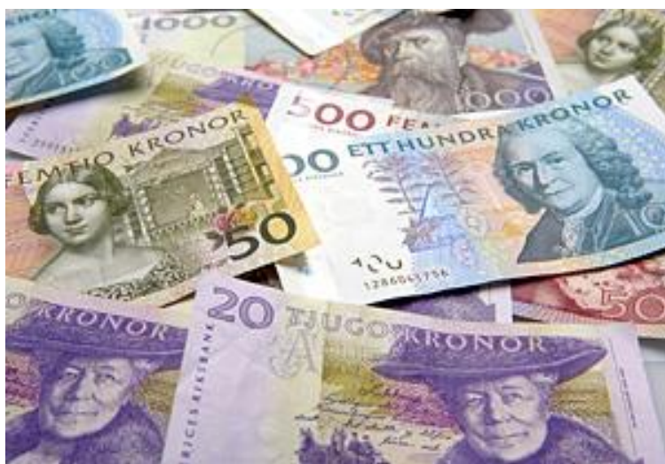
Sedlar från förr: Jenny Lind, Selma Lagerlöf, Carl von Linné, Gustav Wasa

Företaget Aktivt uteliv har etablerat sin verksamhet vid Sunnersta. På vinteraktiviteterna sker ingen större konkurrens mellan verksamheterna, utan det har under året varit ett komplement mellan Friluftsförbundet och Aktivt uteliv. Dock har slalomklubbens uthyrning och fiket i backen fått ökad konkurrens, som Friluftsförbundet har ett mångårigt samarbete