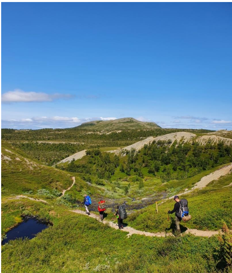
Friluftsförbundet Uppsala vandrar.

På grund av pandemin blev vi tvungna revidera våra planerade fjällaktiviteter något. Den planerade och fullbokade skidturen gick inte att genomföra med de restriktioner som då gällde. Det blev i stället en privat tur med få deltagare.