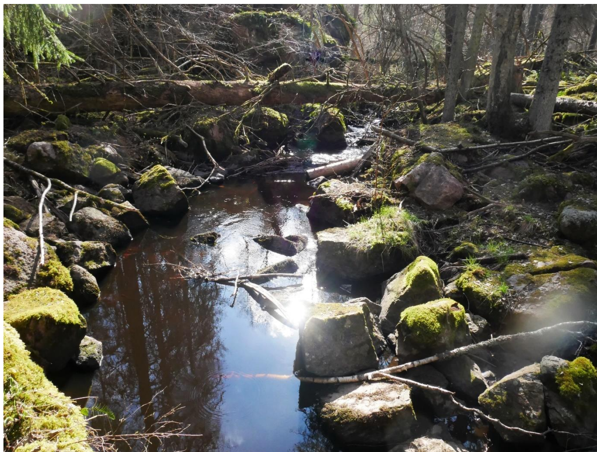
Bild: Friluftsfrämjandets tur tillsammans med Diabetikerförbundet till Fiby urskog våren 2021.