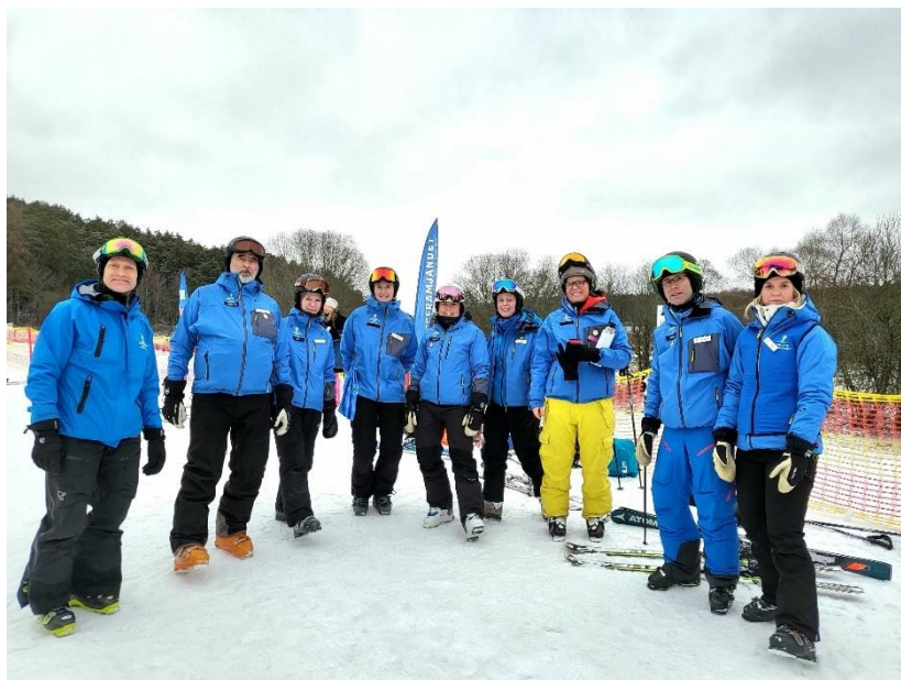
Skidledare i Sunnerstabacken.

Friluftsförbundet's historia bygger till stor del på skidåkning. Grunden i snöverksamheten är skid- och snowboardskolan i Sunnerstabacken i Uppsala. Där har Friluftsförbundet en stolt verksamhet som bedrivits under minst 50 års tid. Det är ett högt tryck på skidskoleverksamheten och platserna till skidskolan blir bokade mycket snabbt.