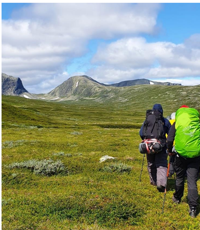
Friluftsförbundet Uppsala på vandring.