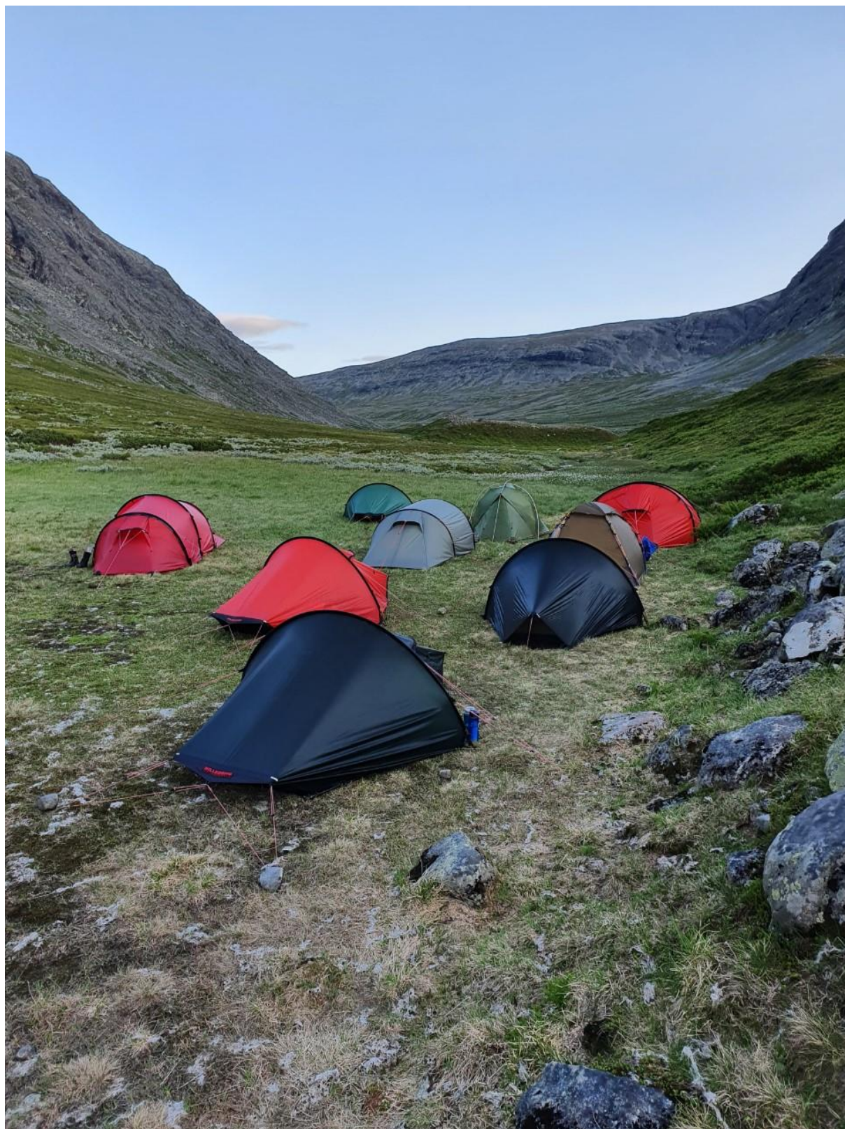
Friluftsfrämjandet Uppsalas "basläger". Tunneltält verkar föredras men även någon kupol.