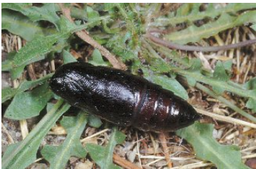
Vampyrfjäril som PUPPA

Längst fram har den en snabel som kan föras in under huden på människor och djur.