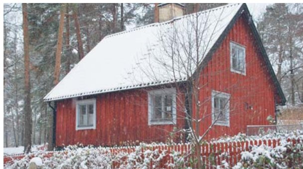
Grindstugan på Torekällberget – vår föreningslokal.