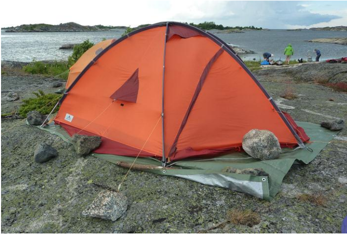
Stora stenar krävs i blåsten

Vår tredje paddeldag, lördag, bjuder på mycket sol, rätt svala och starka vindar. Morgondoppet är skönt men svalt. Frukosten som vanligt härlig. Vi paddlar österut från vår tältö Inra Hamnskär. Vi snirklar oss framåt bland öar och skär och försöker få så mycket vindskydd som möjligt. På Hallskär blir det f.m. kaffe och för våra geocacheentusiaster finns en cache att leta och finna.