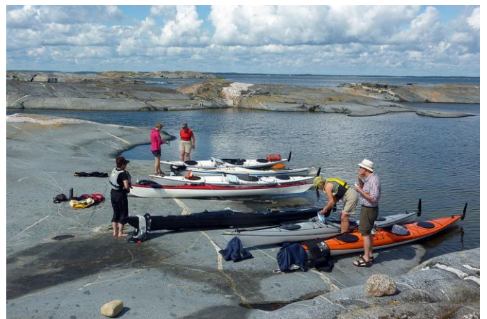
Kaffe på Håkansskär fina klippor