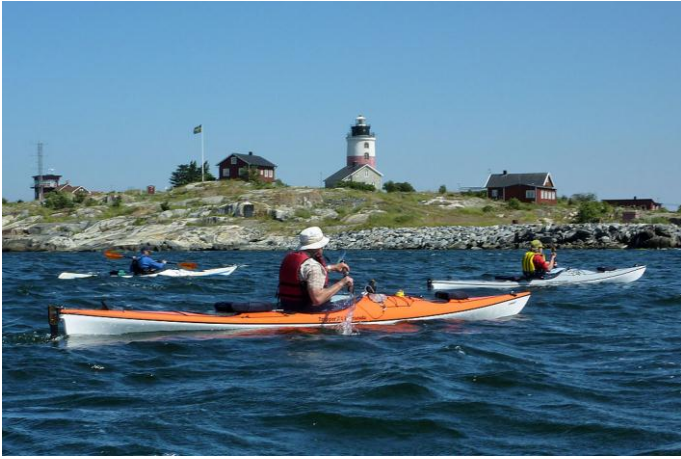
Vi närmar oss Söderarm i vågorna