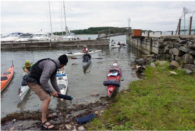
Anländer till Fejan

Överfarten går via fyren på Lerskärsgrund. Vi bestämmer oss för att äta lunch på restaurangen på Fejan. Vi tar gott om tid på oss för besök både i kajakuthyrningen och för att se oss omkring bland byggnader som varit kolerasjukhus m.m. Det kommer skurar emellanåt men sitter man rätt klädd i en kajak gör det ingenting.