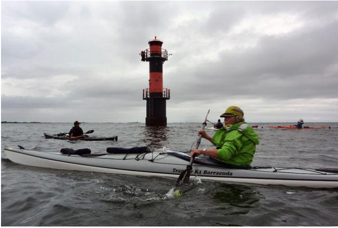
Fyren mitt i farleden vid Lerskärsgrund

Överfarten går via fyren på Lerskärsgrund. Vi bestämmer oss för att äta lunch på restaurangen på Fejan. Vi tar gott om tid på oss för besök både i kajakuthyrningen och för att se oss omkring bland byggnader som varit kolerasjukhus m.m. Det kommer skurar emellanåt men sitter man rätt klädd i en kajak gör det ingenting.