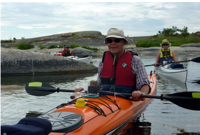
Vindlingarna vid Hämtan

På fredagen ska vinden vara mindre och vår plan att paddla till Håkansskär håller. Vi snirklar fram bland skären. Gjushararna, Inre Håkansskär, Hämtan osv. på lugna vatten. Förmiddagsfika på Håkansskär ger energi till kropp och själ. När vi paddlar vidare sydost är det MÖRKA moln över fastlandet. Vattungarna måste besökas men denna gång bara från kajaken. På Österskär går vi in i en skyddad vik åt norr. Det är stor väderdramatik. Åska, blixtar, kolsvarta hotande moln MEN inget kommer över oss! Vi avvaktar vädret. Lunchar. Någon badar. Den här sommaren har inte varmt upp havet (hittills). 13 grader är det. När vi paddlar vidare har vi mycket vind och dagsetappen blir kortare pga detta. Tältplatser denna kväll blir på Inra Hamnskär. Fina tältplatser men de flesta av oss får ha tälten i hård vind. Vi lägger in stenar i tälten för att få dem stå kvar förutom förankringen utanför. Den lugnaste ytan väljer vi till gemensam matplats.