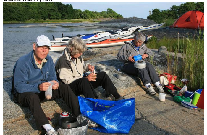
Kvällsmat på Hummelskären