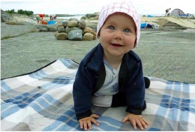
Tilde njuter av klipporna