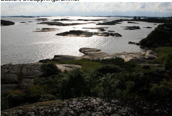
Kobbarna utanför Hummelskären i kvällssol