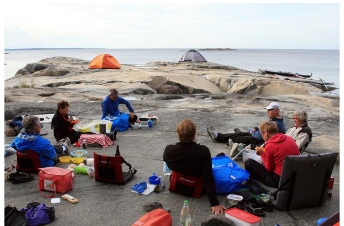
Kvällsmat i lä