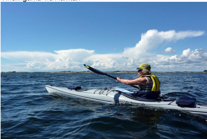
Hotande moln i fjärran