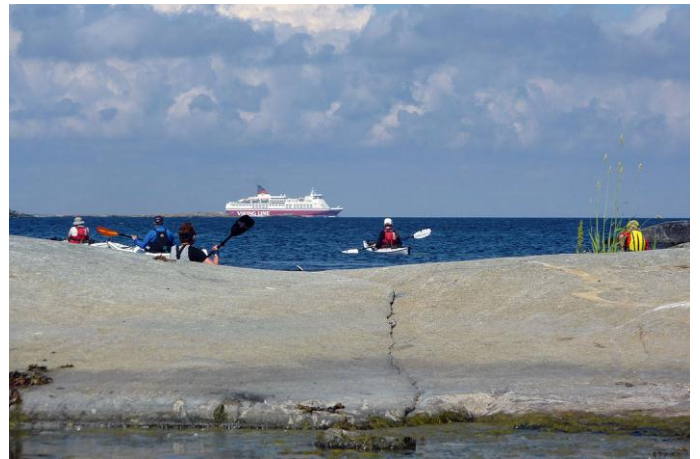
Vi lämnar Hallskär, mot Söderarm

Vi fortsätter den korta sträckan mot Torskär och Söderarms fyr. Några av oss har varit här förut men dagens besök blir extra bra. Vi träffar på paret som sköter anläggningen sedan ungefär 10 år tillbaka. Idag får vi guidad visning till bastun som är en upplevelse. Den är en bunker från andra världskriget. Bastu, avslappningsrum, naturligt bad i klippa och härligt ”uterum” mot söder. Vi får visning i fyren också. Innan vi ger oss iväg efter flera timmars besök äter vi lunch. Vi bestämmer oss för att göra nattläger redan på Hummelskären. Paddlingssträckan blev inte mer än 13 km idag. Väderprognosen för söndagen är gynnsam vad gäller vinden så därför gör vi detta val. Kvällen är fin men kylig för att vara högsommar. Jackor och byxor är skönt!