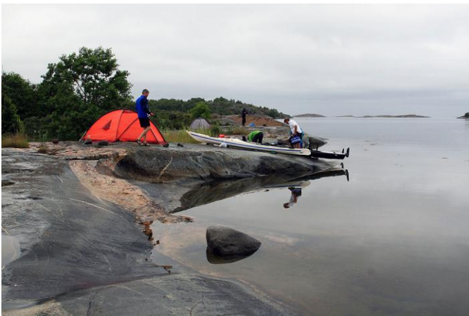
Lugn efter regnet på söndagsmorgonen

På söndagsmorgonen klockan 3 börjar det regna. Det regnar ihållande till klockan 8 och vi äter alla frukost i våra tält. När vi packar kajakerna har vi uppehåll vilket underlättar mycket. Idag är det lugnt, svaga medvindar. Det kommer regnskurar ibland. Vi tar f.m.kaffe i uppehållsväder på Västra Lerskäret på sydostsidan. Finlandsbåtarna går i tät trafik norr om ön. I en kajak är man liten jämfört med de enorma båtarna.