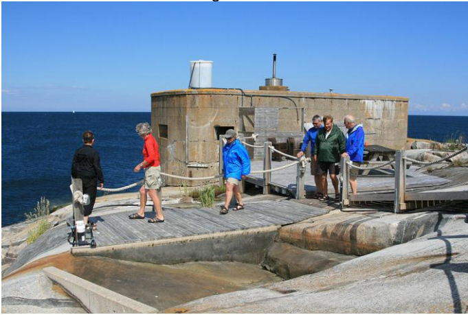
Bastun med badkaret utanför