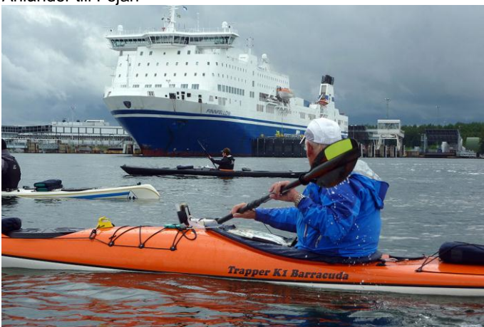
Passerar nyanlönt fartyg vid Kapellskår

Vi går iland på badplatsen som var vår startpunkt och känner oss nöjda. Vi har trots svår väderprognos haft mycket tur tycker vi. Vi har kunnat komma till ställen vi ville se såsom Håkansskär och Söderarm. Visserligen blev två dagar kortare ur paddlingssynpunkt pga vindarna. Doppen blev färre pga badtemperatur och väder. De cacher som var gömda hittades och vi hade trevligt umgänge (som vanligt!)