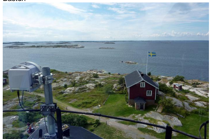
Utsikt från fyren