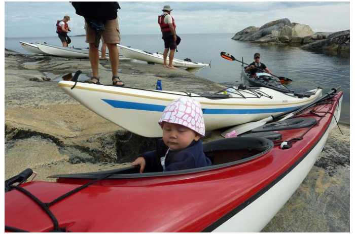
Det ska böjas i tid ...

På fredagen ska vinden vara mindre och vår plan att paddla till Håkansskär håller. Vi snirklar fram bland skären. Gjushararna, Inre Håkansskär, Hämtan osv. på lugna vatten. Förmiddagsfika på Håkansskär ger energi till kropp och själ. När vi paddlar vidare sydost är det MÖRKA moln över fastlandet. Vattungarna måste besökas men denna gång bara från kajaken. På Österskär går vi in i en skyddad vik åt norr. Det är stor väderdramatik. Åska, blixtar, kolsvarta hotande moln MEN inget kommer över oss! Vi avvaktar vädret. Lunchar. Någon badar. Den här sommaren har inte varmt upp havet (hittills). 13 grader är det. När vi paddlar vidare har vi mycket vind och dagsetappen blir kortare pga detta. Tältplatser denna kväll blir på Inra Hamnskär. Fina tältplatser men de flesta av oss får ha tälten i hård vind. Vi lägger in stenar i tälten för att få dem stå kvar förutom förankringen utanför. Den lugnaste ytan väljer vi till gemensam matplats.