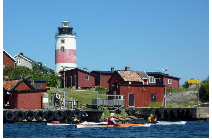
Söderarms fyr, museum m.m.