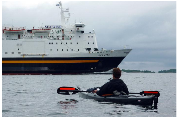
Britt-Marie ger fraktfartyget företräde