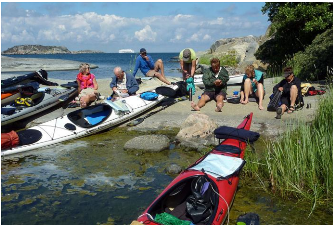
Kaffe vid Hallskär, nytt naturreservat

Vår tredje paddeldag, lördag, bjuder på mycket sol, rätt svala och starka vindar. Morgondoppet är skönt men svalt. Frukosten som vanligt härlig. Vi paddlar österut från vår tältö Inra Hamnskär. Vi snirklar oss framåt bland öar och skär och försöker få så mycket vindskydd som möjligt. På Hallskär blir det f.m. kaffe och för våra geocacheentusiaster finns en cache att leta och finna.