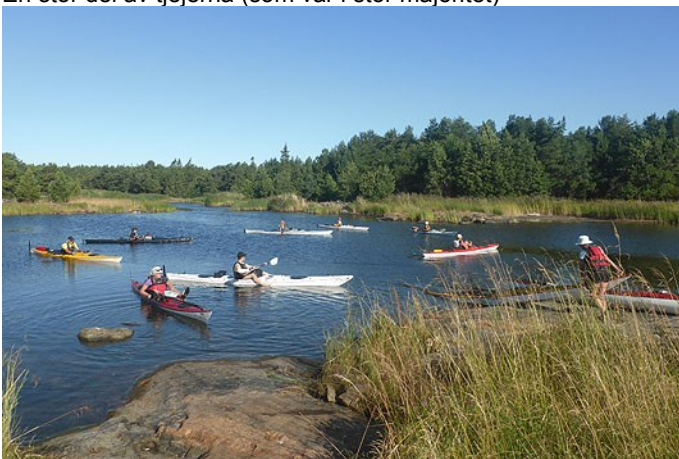
Avfärd från den skyddade Alarängsviken på östra Örskär