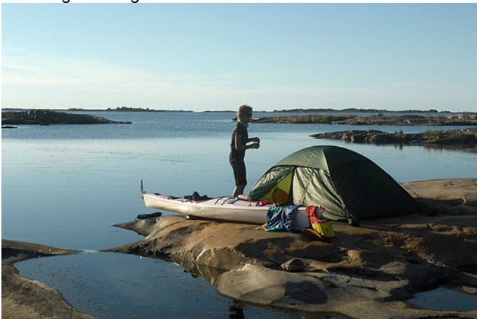
Kerstins havsnära läge