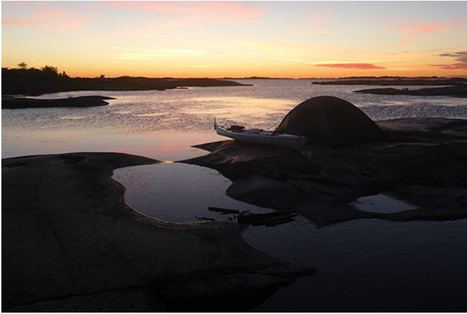
Solen har just gått ner vid niotiden