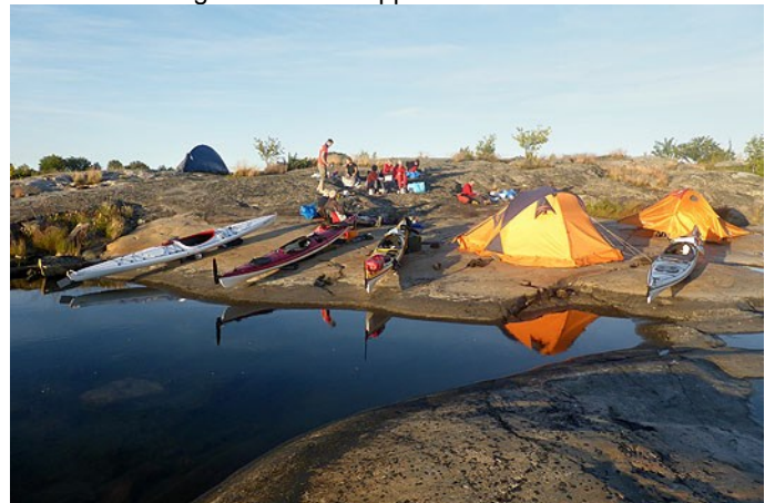
Gemensam middag vid tälten