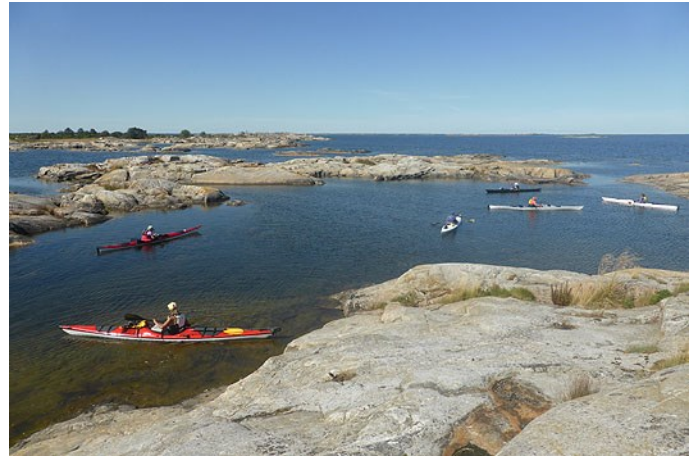
Lagun norr om Gåsgrunden (fika och bad)