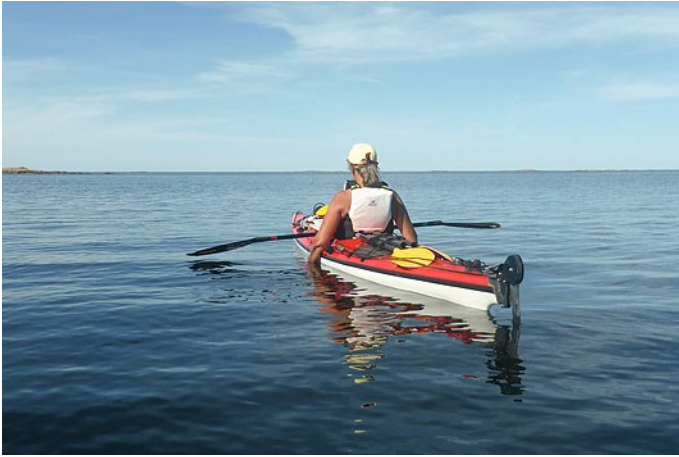
Birgitta kyler händerna