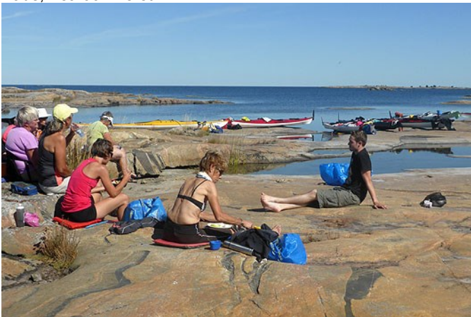
Lunch på Bryggebådans fina klippor