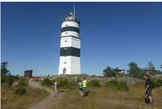
På väg mot Örskärs fyr

Nu väntade Örskär, ett besök i fyren och kanske en glass? Under förmiddagen tilltog den ostliga vinden och vågorna växte till en storlek som fick "tanternas prat att tystna", som en av deltagarna uttryckte det. Vi gled snabbt upp mot Örskärs sydöstra spets i medvinden, gruppens yngling med ett stort leende i ansiktet efter att ha fångat en lyckad surfvåg. Efter lunchen beslutade vi att promenera till fyren istället för att ge oss ut i vågorna igen, ett klokt beslut. Fyrtornet bjöd på en magnifik utsikt! Den efterlängtdade glassen däremot var slutsåld. Tillbaka vid kajakerna och efter en kort paddling till de tänkta tälthällarna valde delar av gruppen att slå läger medan andra paddlade ut och kände på vågorna som skummade mellan bränningarna runt Örskärs grunda och steniga kust.