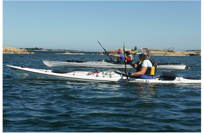
På väg mot Långanäs

Sammanfattningsvis hade vi en underbar tur, med vackert väder och en härligt blandad grupp deltagare som ivrigt delade med sig av erfarenheter och tankar. Vi fick se stora delar av Gräsö skärgård, inkl. bådorna längst ut.