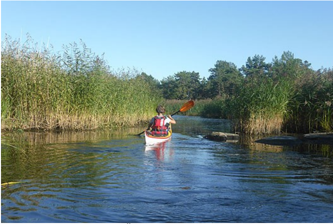
Alarängsviken på östra Örskär