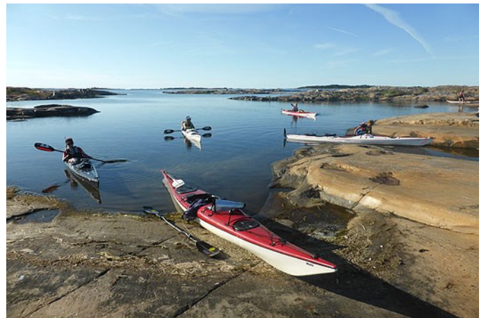
Anländer Storlågånens fina klippor fram emot kvällen