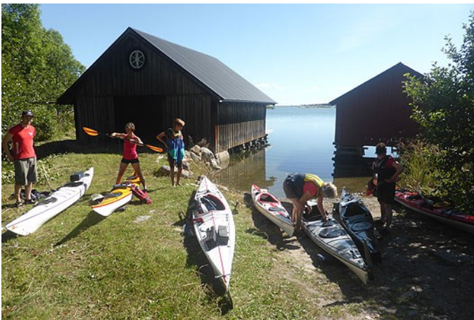
Packning vid Långanäs

Efter sedvanligt packande och trixande och efter att vår sista deltagare anslutit till startplatsen sjösatte vi de 11 kajakerna och styrde kosan söderut mot lunch på Digelskäret. Efter en härlig lunch i lä bakom en solvarm klippa snirklade vi vidare söderut i en snabbt avtagande vind. Skulle vi våga oss ut till de yttre skären? Vi konsulterade SMHI en sista gång och gav oss av mot de låga, vackra kobbarna. Ett fint nattläger hittade vi på Storlågån. Kvällsol och solnedgång i havet, vad mer kan man begära?