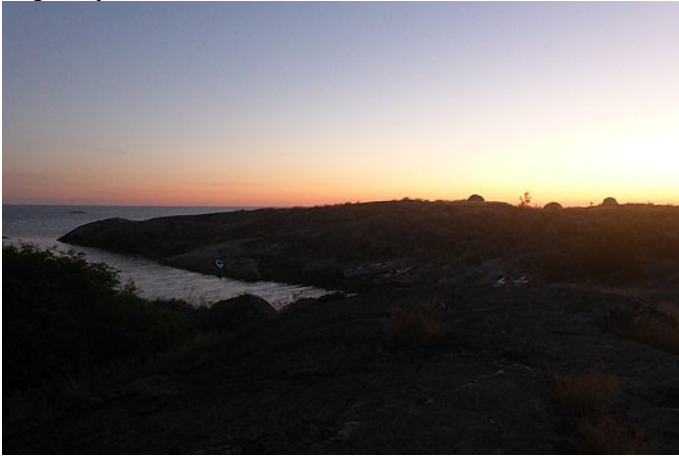
Snart soluppgång över Fluttu, tälten på höjden