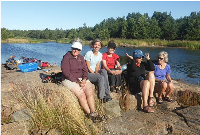
En stor del av tjejerna (som var i stor majoritet)

Sista dagen valde vi att stiga upp tidigare och paddla mot trygga vatten medan vinden var svag. Det gav oss gott om tid att bada och njuta bland kobbarna även denna sista dag. Det var med blandade känslor vi gick iland vid Långanäs och påbörjade bilresan söderut.