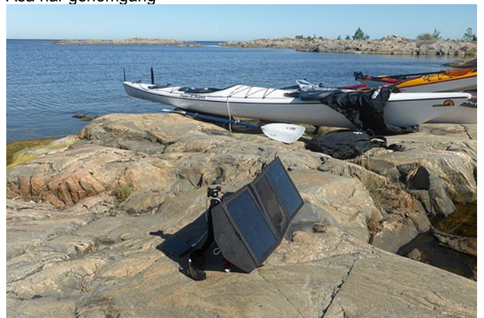
Förnyelsebar energi till Jacobs elektronik