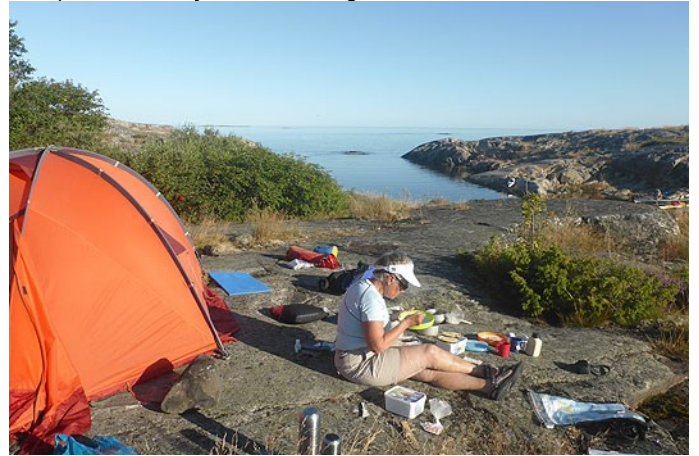
Camilla åter frukost, den fina viken i bakgrunden

Nu väntade Örskär, ett besök i fyren och kanske en glass? Under förmiddagen tilltog den ostliga vinden och vågorna växte till en storlek som fick "tanternas prat att tystna", som en av deltagarna uttryckte det. Vi gled snabbt upp mot Örskärs sydöstra spets i medvinden, gruppens yngling med ett stort leende i ansiktet efter att ha fångat en lyckad surfvåg. Efter lunchen beslutade vi att promenera till fyren istället för att ge oss ut i vågorna igen, ett klokt beslut. Fyrtornet bjöd på en magnifik utsikt! Den efterlängtdade glassen däremot var slutsåld. Tillbaka vid kajakerna och efter en kort paddling till de tänkta tälthällarna valde delar av gruppen att slå läger medan andra paddlade ut och kände på vågorna som skummade mellan bränningarna runt Örskärs grunda och steniga kust.