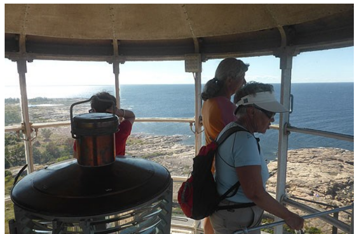
Uppe i fyren